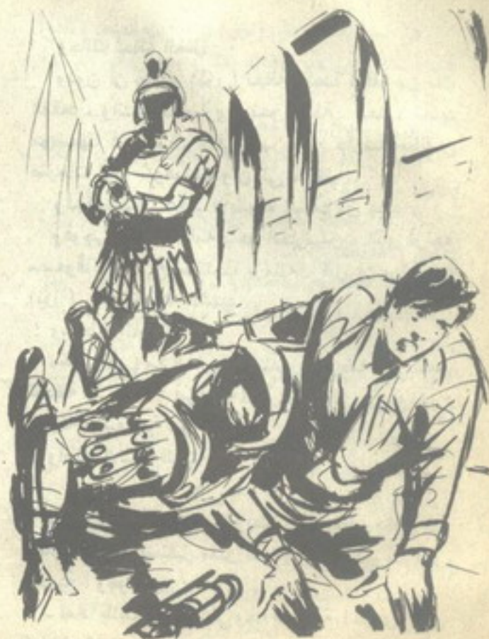
سقط (نور) مع الحارس ، وتدحرجا أرضاً ، فى نفس اللحظة التى استدار فيها إليه الحارس الأخر

- اتصل بهذا الأحمق على الفور ، ومره بإنهاء العملية ، وتسليم نفسه للسلطات المصرية ، فربما كان هذا هو الحل الوحيد ، لإنهاء العملية دون خسائر تُذكر .