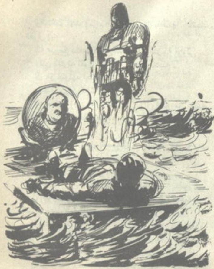
هبط (س-١٨) فوق الطوف ، ونقل بصره في برود آلى بين (نور) وصوره (مالوس) .. كان من الضرورى أن يتخذ قرارًا واحدًا ..

وبفرحة غامرة ، هتف (بيكاس) : - لقد أتى .. إنها معجزة .. لقد جاء الآلى لنجدته ! أما (مالوس) ، فقد اتسعت عيناه في ذهول شديد في البداية ، ثم صرخ فجأة : - ابتعد يا (س-١٨) .. أطع أوامرى .. أنا أحد صاتعيك .. تراجع يا (س-١٨) .. هذا أمر . صاح (نور) : - أنقذنى يا (س-١٨) .. حطم هذه القيود ، وأبعدنى عن هنا . عاد (مالوس) بصرخ : - مستحيل !.. إنك ستطيع أوامرى وحسدى يا (س-١٨) .. هكذا صنعناك .. إنك تطيع أوامر سادتك أولًا . هبط (س-١٨) فوق الطوف ، ونقل بصره في برود آلى بين (نور) وصورة (مالوس) .. كان من الضرورى أن يتخذ قرارًا واحدًا .. وهو قرار من النوع الثالث ، كما يسميه علماء الفكر البشرى .. قرار يحتاج اتخاذه إلى دراسته ، وتحديد ، و ... وإرادة ..