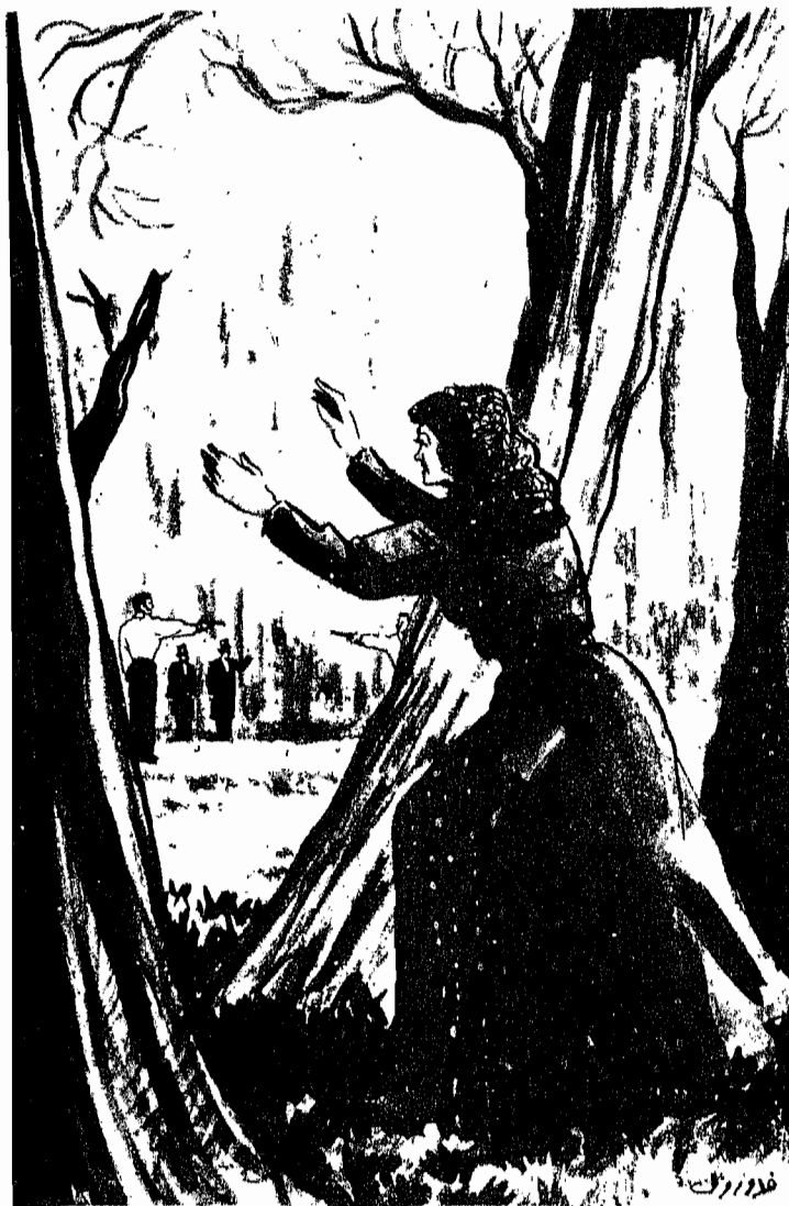
« ووقف الاثنان تفصل بينهما ثلاث خطوات »