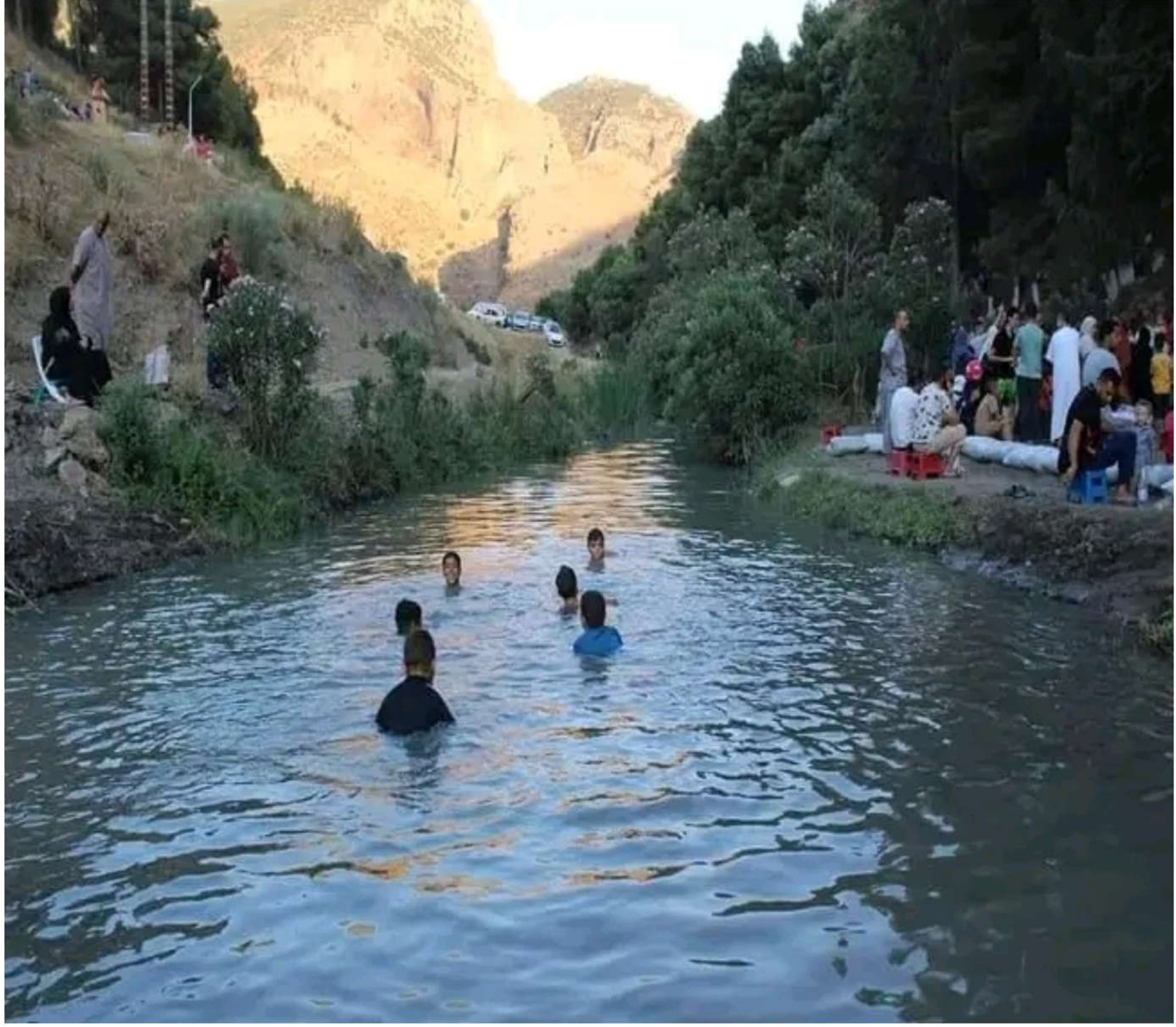
حمام قرقور. وبعض الأماكن المحيطة بالحمام.