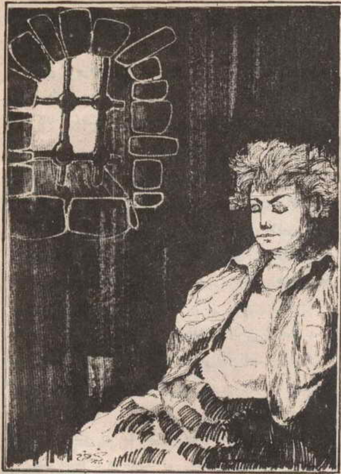
وفي المخزن اختار « تحتخ » كنية قديمة وتمدد عليها واستسلم للنوم .

قال « عاطف » : لن تعيد صيحاتك الحرارة إلى التليفون ، سأذهب أنا سريعاً بالدراجة إلى منزل « محب » فهو قريب منا ،