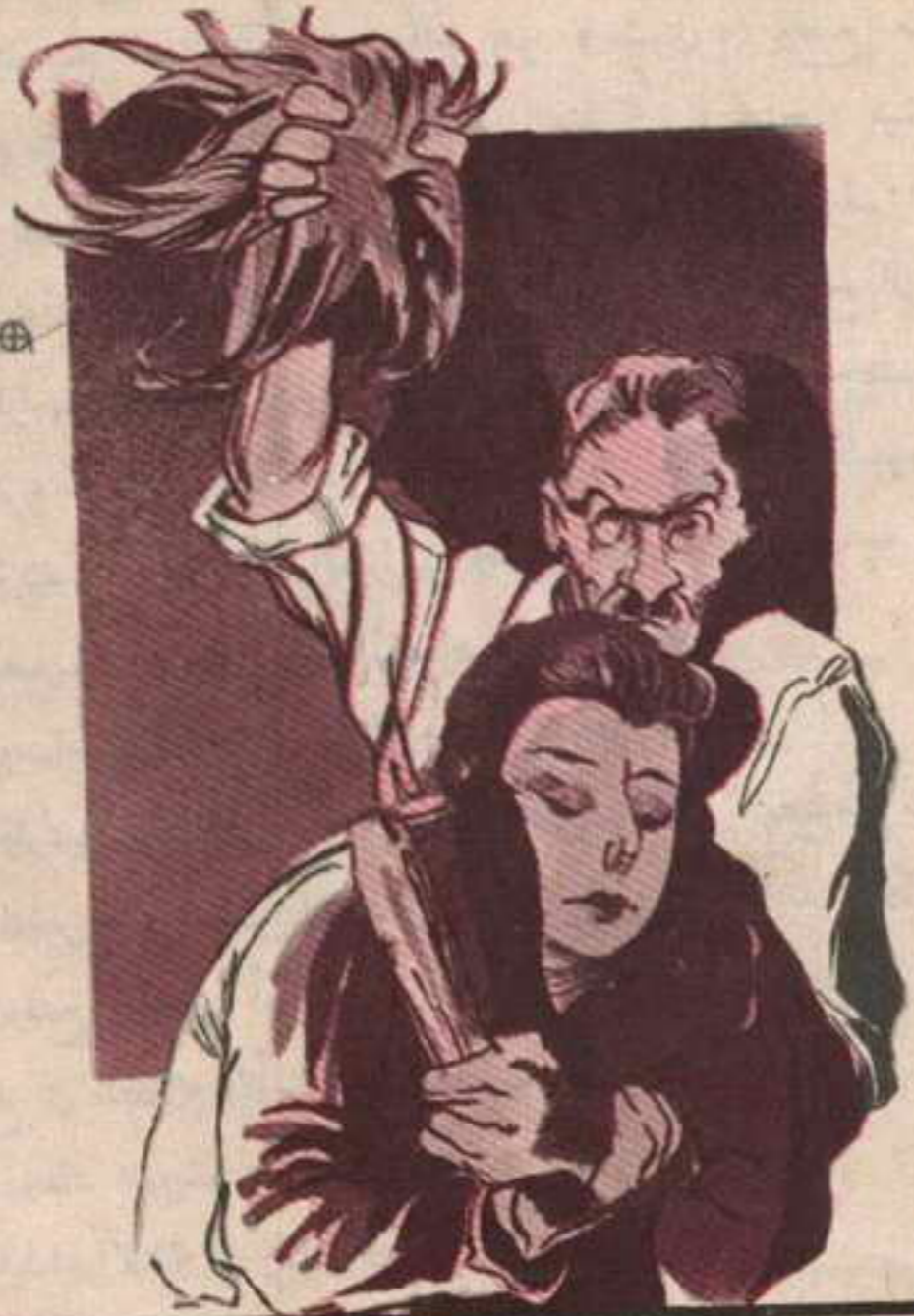
انقض عصفور على « تختخ » صائحاً وأمسكه من شعره وكانت أكبر مفاجأة « لعصفور » فقد وجد الشعر في يده .

وانقض « عصفور » على « تختخ » صائحاً .. وزاغ « تختخ » منه .. ولكن « عصفور » أمسكه من شعره .. وكانت أكبر مفاجأة « لعصفور » في حياته عندما وجد الشعر