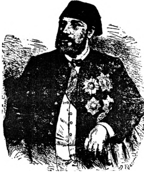
إسماعيل باشا الذي افتتح القناة.

وباعت الحكومة سنة ١٨٧٥ أسهمها في شركة القناة لإنجلترا بأربعة ملايين جنيه، وأصبح ثمنها ٥٢ مليون جنيه إنجليزي سنة ١٩٣٢. وربحت إنجلترا ٤٣ مليون جنيه إنجليزي من تاريخ الشراء إلى سنة ١٩٣٢، وأصبح ما تملكه إنجلترا يعادل ٤٤٪.