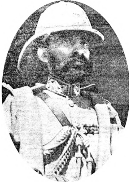
جلالة هيلا سيلاسي إمبراطور الحبشة الحالي.

العاجل من وضع المؤلفات الأخرى في الحروب الحبشية وفق ما يوده المؤلف من بيان كامل وتحقيق وبالذقة المعروفة عنه في مؤلفاته وكتاباته وبحوثه القانونية المشهورة. ويجد القارئ في هذا الكتاب بيانات مفيدة عن الحبشة وعاداتها وحكامها وملوكها، وعلاقاتها بغيرها وبإيطاليا والسودان ومصر، وعصبة الأمم ووظيفتها، وقناة السويس ومسألة إغلاقها، والغارات الجوية والغازات الخانقة — وقانا الله شرها، فضلاً عن ذلك فإن حضرة الأستاذ المؤلف يُعدُّ أول مؤرخ في العالم قد أرخ الحوادث الأخيرة التي وقعت بين سبتمبر وأكتوبر سنة ١٩٣٥، وأرجو أن يوفقه الله إلى تأريخ الحوادث التالية.