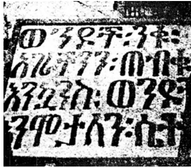
كتابة اللغة الأمهرية (اللغة الرسمية الحبشية).

قنصل فرنسا بالإسكندرية لمحمد علي باشا؛ فقد استمال رجال عثمان البرديسي من المماليك إلى جانب محمد علي للقضاء على محمد بك الألفي عدوهما المشترك. وأخيراً كُتِبَ النجاح التام لمحمد علي باشا بأن تُوِّفِيَ البرديسي في نوفمبر سنة ١٨٠٦، ثم الألفي في يناير سنة ١٨٠٧، وصفا له الجو بعدهما. غير أن إنجلترا كان قد ساءها فشل مساعيها في الأستانة لمعاونة الألفي كما ذكرنا، فأنزلت بمصر في ١٧ مارس سنة ١٨٠٧ نحو سبعة آلاف إلى ثمانية آلاف من الجنود الإنجليزية لتبعث الحمية في نفوس المماليك ومد يد المساعدة إليهم؛ فاستولت على مدينة الإسكندرية بقيادة الجنرال «فرازز»، ومكثت ستة أشهر من دون أن تتمكن من الإقدام على عمل آخر، وتوجهت شرذمة من ذلك الجند إلى رشيد، وهناك التقت بالعساكر الألبانية التي أسرع بجمعها محمد علي باشا، فانهزمت الشرذمة الإنجليزية، ووقع عدد كبير منها في الأسر، أرسلوا إلى القاهرة ثم أطلق محمد علي باشا سراهم بدون فدية؛ مما عدته إنجلترا شهامة منه. ولما رأت إنجلترا فشل هذه الحملة اضطرت إلى الجلاء عن مصر في يوم ١٤ سبتمبر سنة ١٨٠٧.