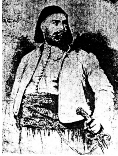
سعيد باشا الذي منح امتياز قناة السويس.

ولما وُلِّي الخديو إسماعيل باشا قال: «أريد أن تكون القناة لمصر، لا مصر للقناة». وأصلح كثيراً من الأخطاء والنزول الذي فعله سعيد باشا، فقام نزاع بين ديلسبس والشركة من جهة وبين الخديو إسماعيل، وقيل الخديو تحكيم صديقه الإمبراطور نابليون الثالث؛ ففرض نابليون لمصلحة الشركة على حساب مصر، قضى لها بتعويض ٣٣٦٠٠٠٠٠ جنيه ثمناً للأراضي التي كانت بين الشركة وصارت للحكومة، وثنماً لنزول الشركة عن حق حفر التربة العذبة، وعن إلزام الحكومة بتقديم العمال.