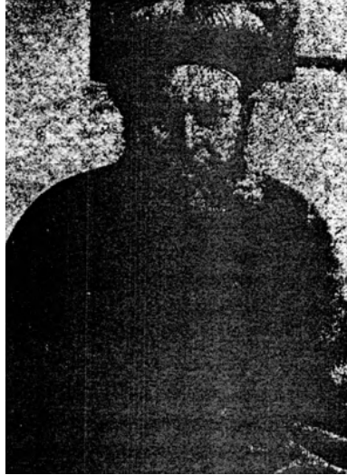
الأنبا كيرلس مطران الحبشة وصديق الإمبراطور ومستشارها.

عند الساحة العاشرة من صباح الجمعة ١١ أكتوبر سنة ١٩٣٥ شهدت الإسكندرية لأول مرة عرضاً عسكرياً اشتركت فيه جميع القوات البريطانية والجيش المصري والبوليس، بحضور المندوب السامي السير مايلز لامبسون ودولة توفيق نسيم باشا رئيس مجلس الوزراء وتوفيق عبد الله باشا وزير الحربية والبحرية وقواد القوات البريطانية والجيش المصري، وبدأ العرض في ميدان محمد علي، ثم مر من الشوارع الأخرى. وانتقدت الصحف المصرية هذا العرض الغريب غير المألوف وقد حصنت طوابي الإسكندرية، وبثت الألغام حوالي الشواطئ.