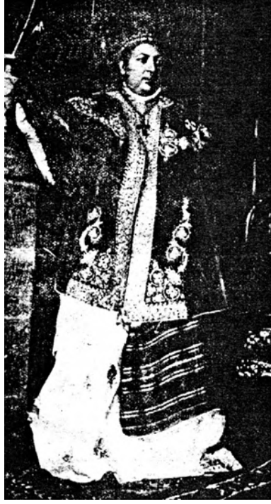
الإمبراطورة الحالية وايزو ممن.

رأيت عندئذ البحث يتسع والموضوع يتشعب، وأن المسألة الحبشية لا بد أن تكون موضوع كتاب خاص، ولا يكفي لها أن تكون فصلاً من فصول كتاب «السودان»، وأن أرجع إلى الصحف في تدوين الأخبار.