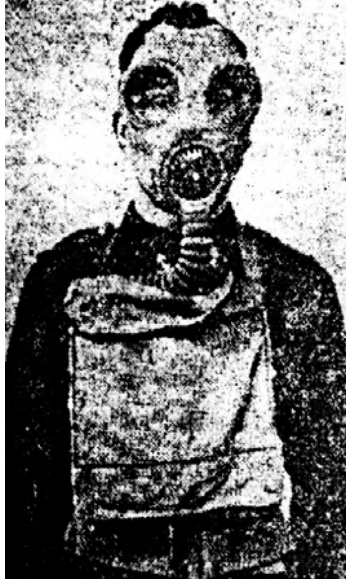
رجل بكمامته الواقية من الغازات.

وللكلور تأثير مهيج شديد، فيسبب حرقاناً شديداً بالعينين والأنف والحلق، ويدخل في الجهاز التنفسي فيسبب التهاباً في القصبة الهوائية وفروعها، بل في حويصلات الهواء في الرئة ذاتها؛ أي ينتج التهاب شعبي رئوي خطير سرعان ما يؤدي بحياة الإنسان. ومن سخرية القدر أو العلم أن هذا الغاز الخانق القتال، الذي يستعمله الإنسان للفتك بعدوه الإنسان، قد أمكن من سبب تذليله لفائدة البشرية عامة؛ إذ إنه مطهر قوي لمياه الشرب. فكمية طفيفة منه لا تتجاوز جزءاً من واحد في المليون تكفي لقتل الميكروبات الضارة في الماء؛ كالتيفود والكوليرا والدوسنتاريا وسواها، في وقت قصير. وربما لا يعلم الكثيرون أن سكان المدن في مصر وسواها من الممالك يشربون شيئاً منه فيما يتناولونه من الماء، وأن أسطوانات الكلور وأجهزته تؤدي ليل نهار هذا الواجب الصحي العظيم في عمليات المياه بالقاهرة والجيزة وإسكندرية وسواها.