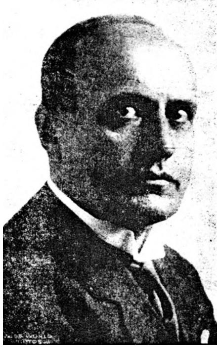
«الدوتشي» السنيور موسوليني زعيم إيطاليا ورئيس حكومتها.

والله أسأل أن يمنحه وافر الصحة والعافية، وأن يحفظه ذخراً للعلم، وأن ينفع به البلاد والعباد، إنه سميع قريب مجيب الدعاء.