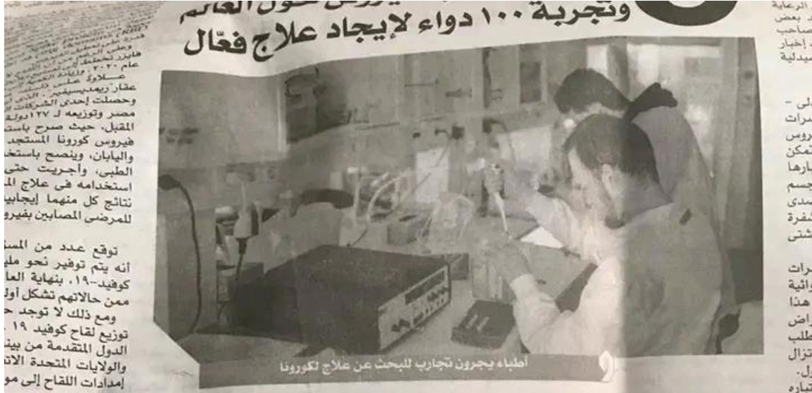
أطباء يجرون تجارب للبحث عن علاج لـكورونا

وتجربة ١٠٠ دواء لإيجاد علاج فعال عقدت منظمة الصحة العالمية اجتماعاً في جنيف، سويسرا، في ١١ مارس ٢٠٢٠، لبحث في تطوير لقاحات ضد فيروس كورونا المستجد. وحصلت إحدى الشركات، من مصر وتوزيعه لـ ١٢٧ دولة المقبل، حيث صرح باستفاد فيروس كورونا المستجد واليابان، وينصح باستفاد الطبي، وأجريت حتى استخدامه في علاج المرضى المصابين بفيروس