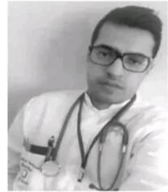
... الرسالة المهمة هي الوقاية لمنع انتشار العدوى