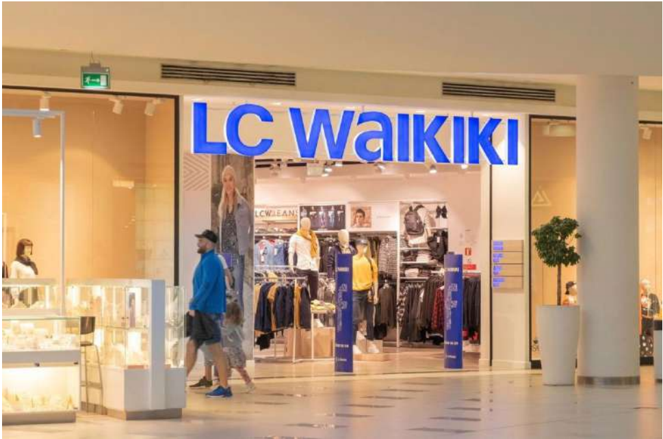
إل سي وايكيني LC Waikiki

وأخذت LC الاسم من شاطئ Waikiki ضمن جزيرة هاواي ومن الأحرف الأولى للكلمات الفرنسية "Les Copains" والتي تعني "الأصدقاء" حسب bifikir.