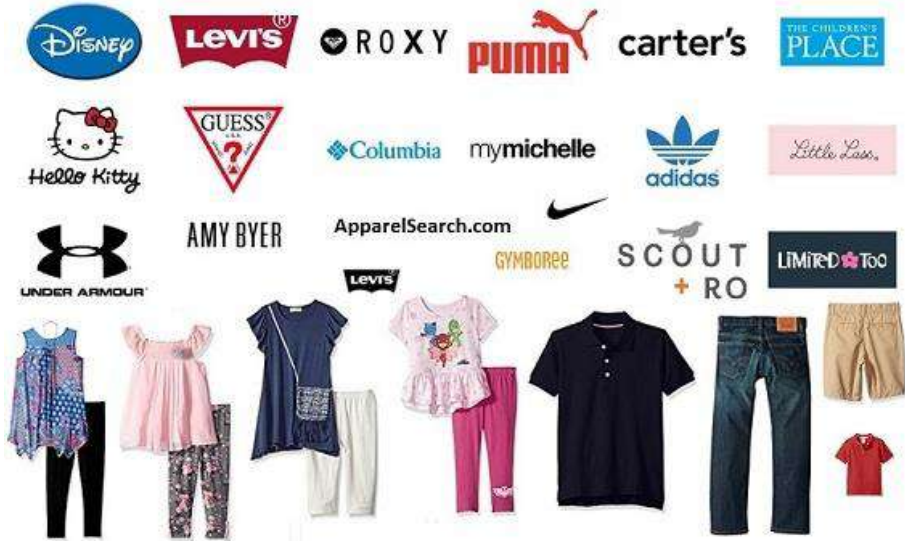
ماركات ملابس أطفال عالمية

لم يعد الأمر مُستحيلًا، تستطيع الآن شراء ملابس أطفالك من أبرز العلامات التجارية حول العالم وأنت تُقيم في تركيا، حيثُ تُوفر لك كُبرى المولات والمحلات التجارية وشوارع التسوق في تركيا مجموعة واسعة من ماركات ملابس الأطفال