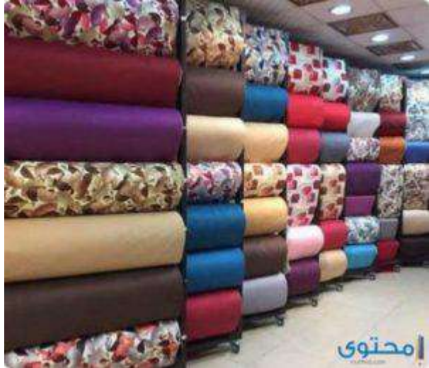
استيراد قماش من تركيا