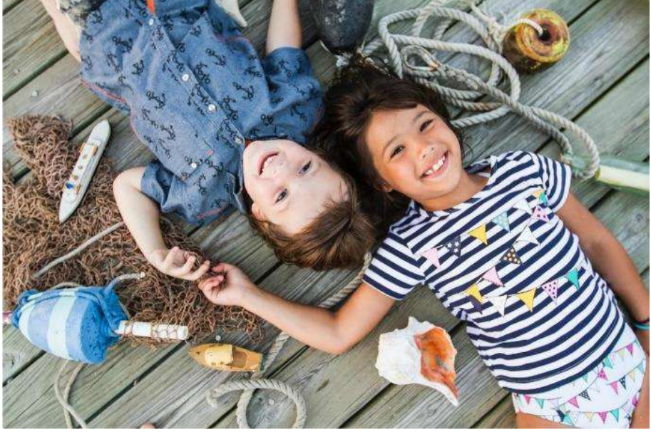
متجر ميني سيتي لملايس الأطفال في تركيا

يُعدّ موقع ميني سيتي التركي (Miny City) خيارًا رائعًا لكافة قطع ملايس الأطفال في المراحل العمرية المختلفة، وتحديدًا القسم الخاص بالملايس التركية، فما عليك سوا التوجه إلى موقع ميني سيتي التركي ، وعيش تجربة تسوق غير مسبوقه في أقسامه.