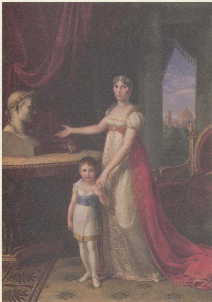
إليزا بونابرت، دوقة توسكانيا الكبيرة وابنتها نابوليون - إليزا. صورة رسمها بيتر بنفينوتي.