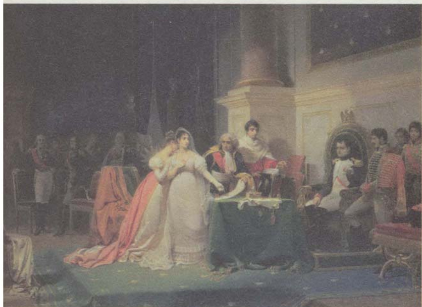
طلاق الإمبراطورة جوزفين، صورة رسمها هنري فريدريك شوبان.