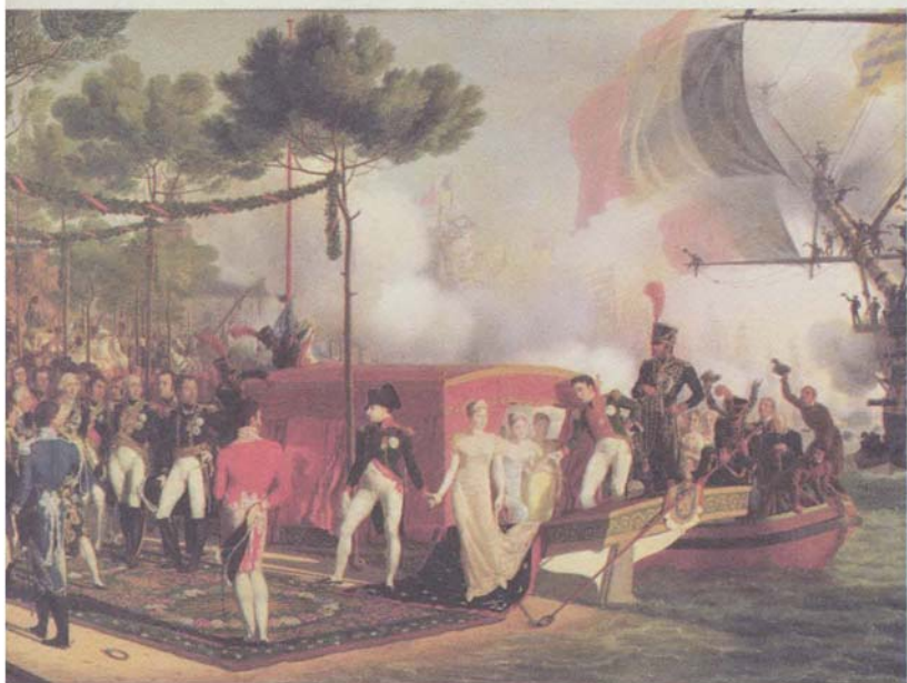
نابليون وماري لويز يترجلان في أنتويرب في أثناء سفرهما في سنة 1810 ، صورة رسمها لويس فيليب كرييان.