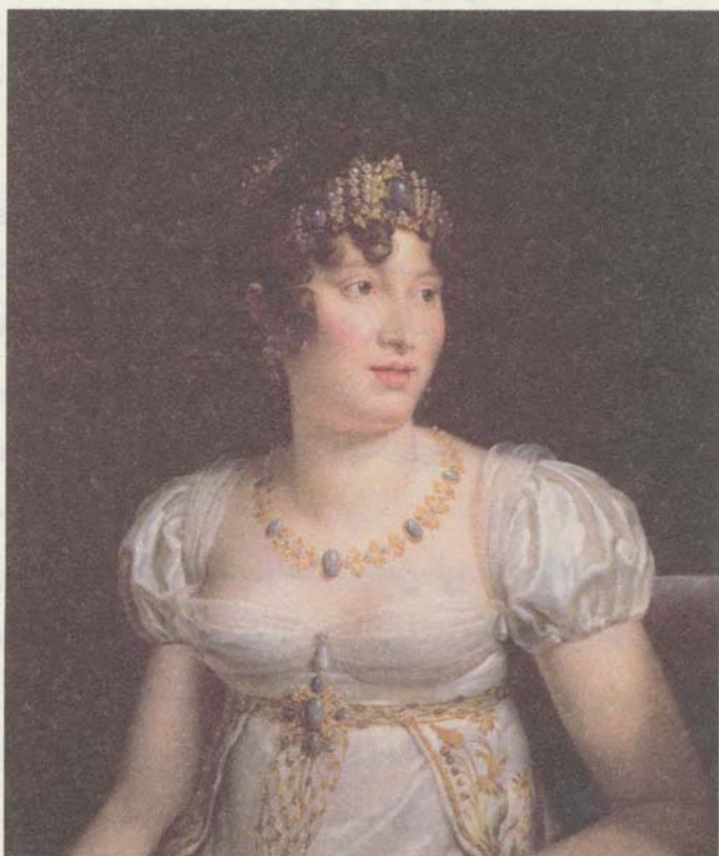
كارولين مورا، ملكة نابولي، صورة رسمها فرانسوا باسكال سيمون، البارون جيرار.