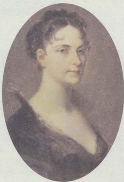
الإمبراطورة جوزفين، صورة رسمها بيار بول برودون.