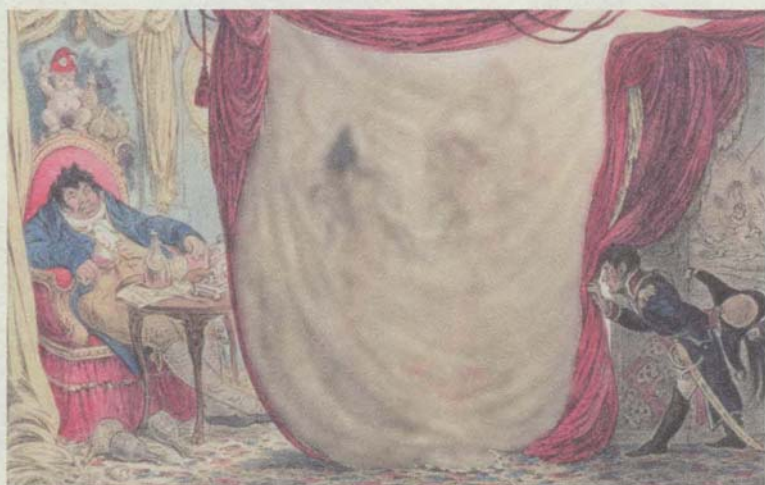
مدام تريزا تاليان والإمبراطورة جوزفين ترقصان عاريتين أمام الفايكونت دي بارا في شتاء 1787.