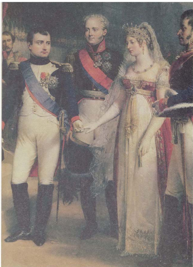
نابليون بونابرت مستقبلاً ملكة بروسيا لويزا في تلسيت في 6 تموز/يوليو 1807، صورة رسمها نيكولا لويس فرانسوا غوس