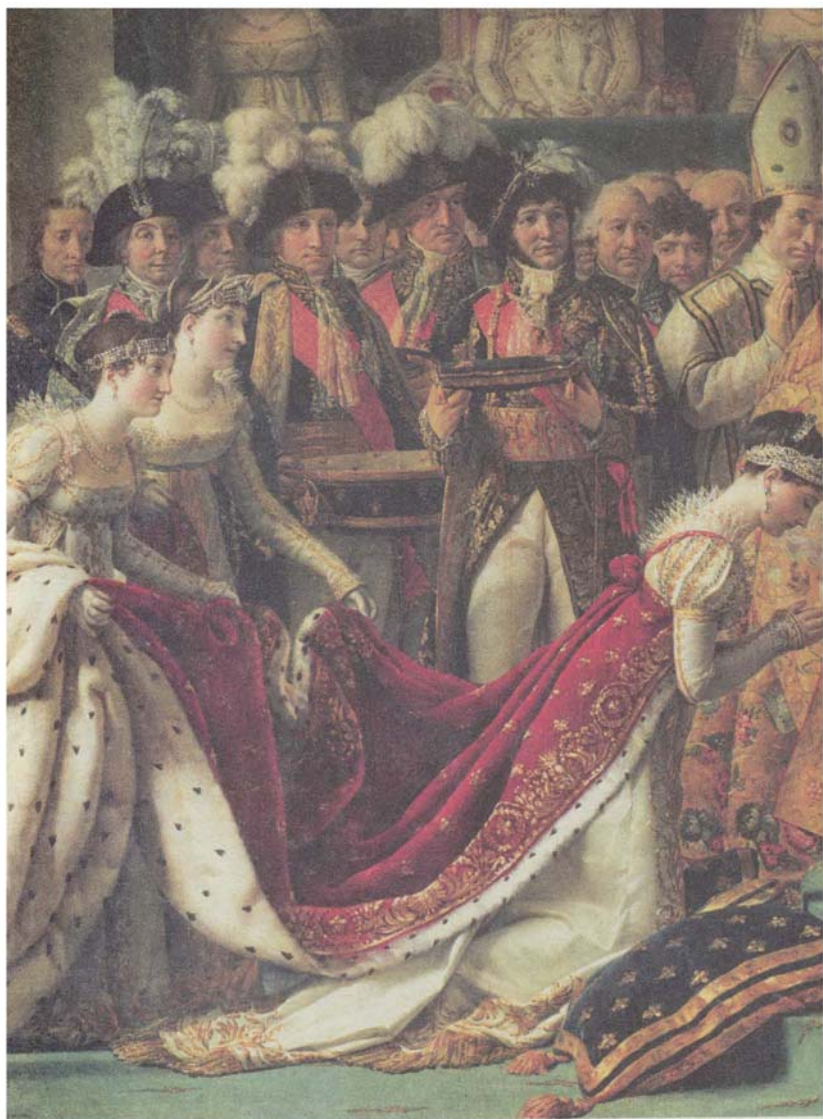
حفل تتويج الإمبراطور نابليون والإمبراطورة جوزفين بحضور البابا بيوس الثاني عشر في 2 ديسمبر 1804، صورة رسمها جاك لويس دافيد.