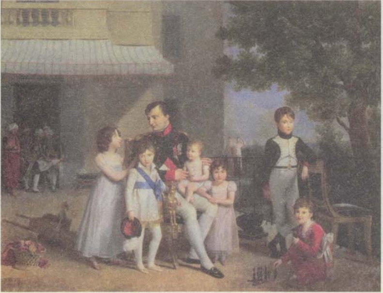
نابليون مع أبناء وبنات إخوته على شرفة قصر سان كلو في سنة 1810، صورة رسمها لويس دوسيس.