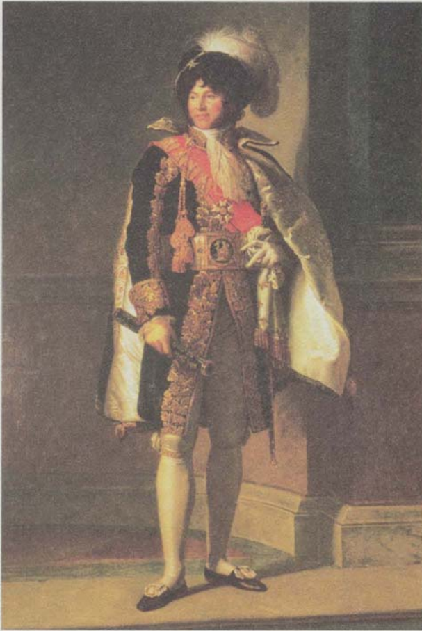
يواكيم مورا، ملك نابولي، صورة رسمها فرانسوا باسكال سيمون، البارون جيرار.