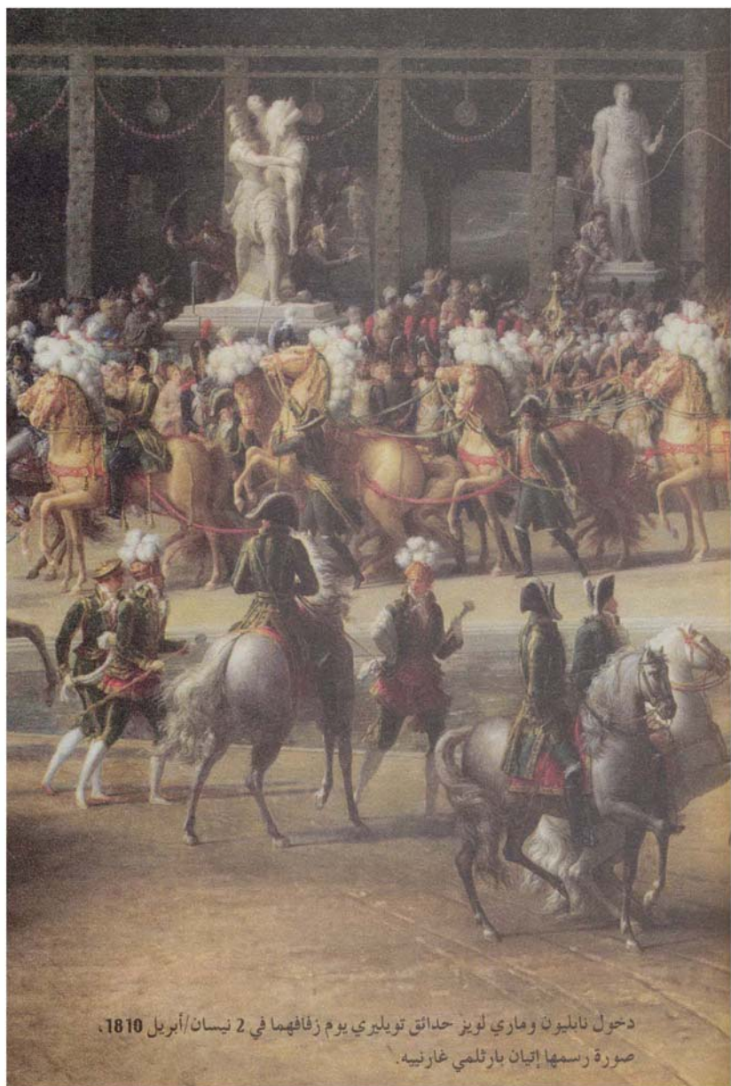
دخول نابليون وماري لويز حدائق تويليري يوم زفافهما في 2 نيسان/أبريل 1810 ، صورة رسمها إتيان بارثلمي غارنييه.