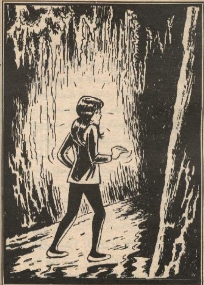
ونزلت علياء إلى الدهليز المظلم

أسرع شادي نحو مصدر استغاثة رامى ، وأخذ يبحث عنه بين الحشائش والأشجار ، وأخيراً رآه غارقاً في مستنقع صغير