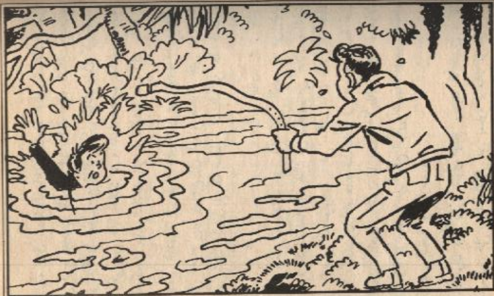
بلی شادی بجزامه لینگد رامی من الفرق فی مياہ المستقع