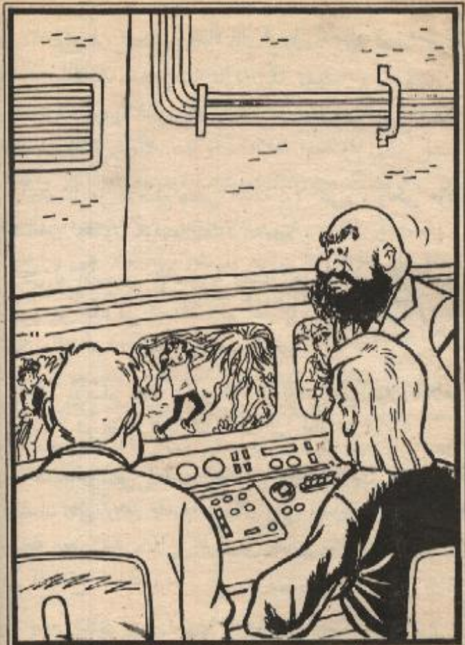
لم يكن أصدقاؤنا يعلمون أن هناك من يراقبهم من خلال شاشات الكمبيوتر

كانت علياء تقاوم بأقصى قوتها لتتخلص من هذا النبات القاتل الذى أخذ يضغط على عنقها بلا رحمة ، وفجأة اقترب من قدميها فرع آخر من نبات ( الدار لنجتونيا ) المزروع فى الحوض الزجاجى بنهاية الغرفة ، كان هذا الغصن شبيهاً بشعبان الكوبرا ،