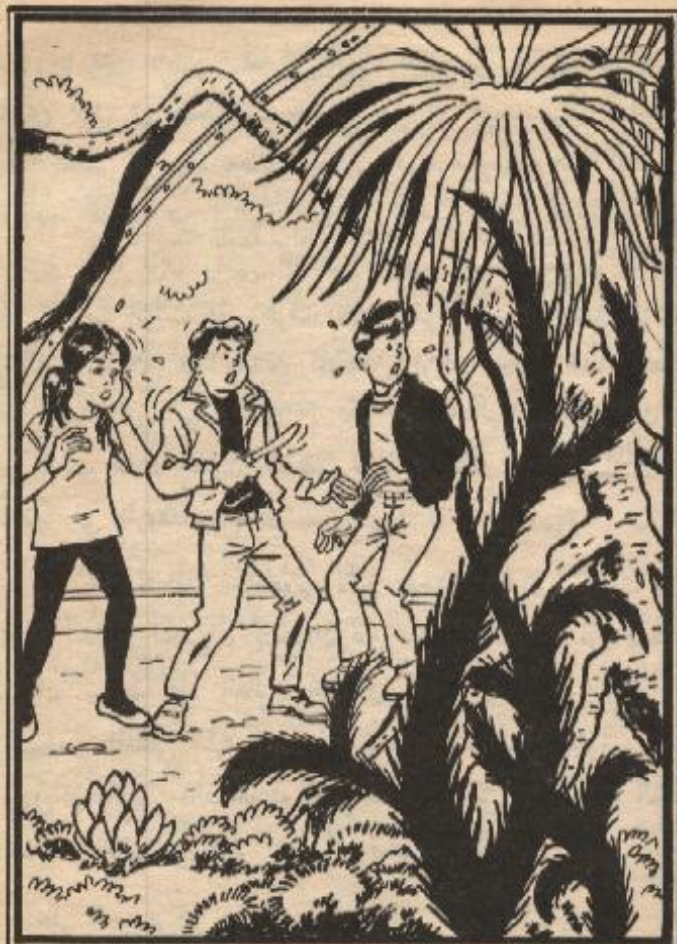
أبطالنا الثلاثة داخل الصخرة العجيبة

الإشعاعى ، وأخذ يطلق أشعته القاتلة على هذه الكائنات العجيبة فى كل اتجاه ، وفجأة صرخت عليها وهى تقول : لقد لدغنى غصن من هذه الأشجار .