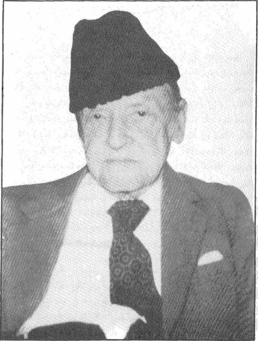
وليام سومرست موم