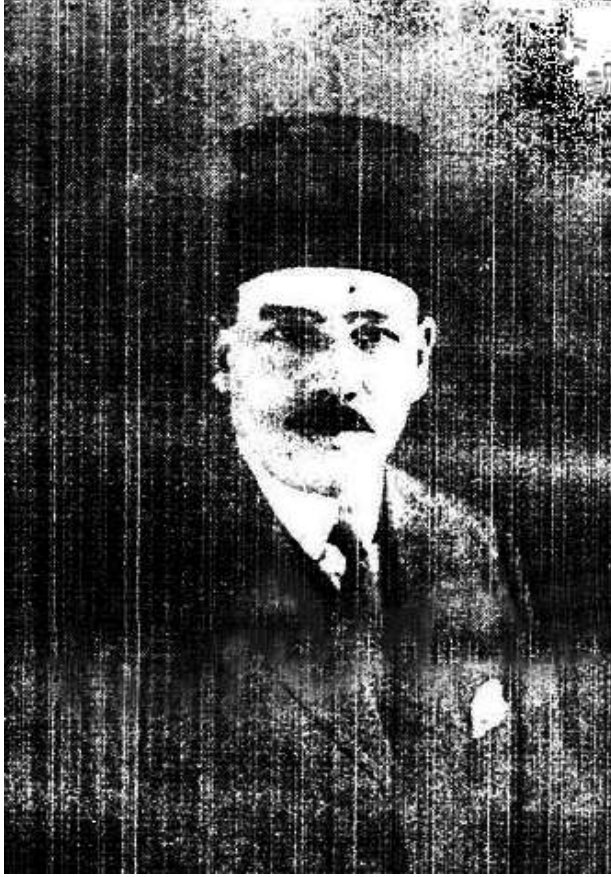
صاحب السعادة الدكتور محمد باشا شاهين – الطبيب الخاص لجلالة الملك، ووكيل وزارة الداخلية للشئون الصحية.