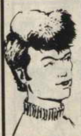
رقم ٦ - مصباح من ليبيا