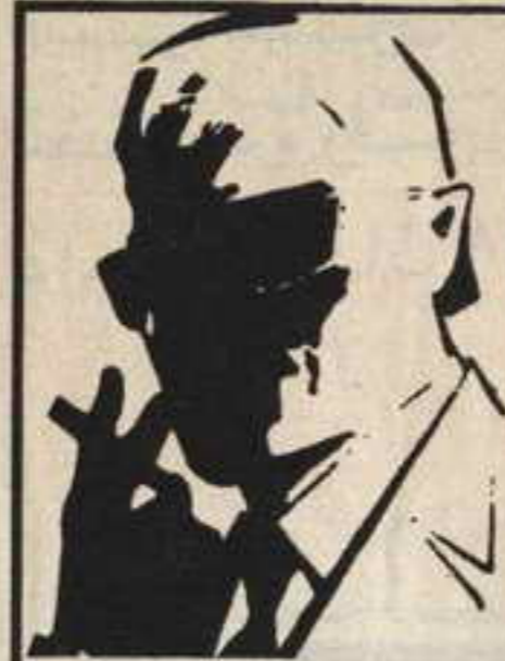
رقم . صفر، الزعيم الغامض الذي لايعرف حقيقته احد ..