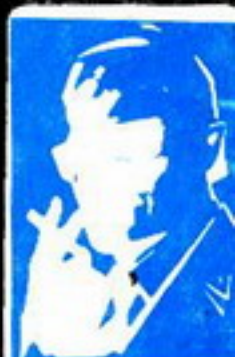
بعد ضم الرصد العاصم المر لا تعرف مصفحة الحد