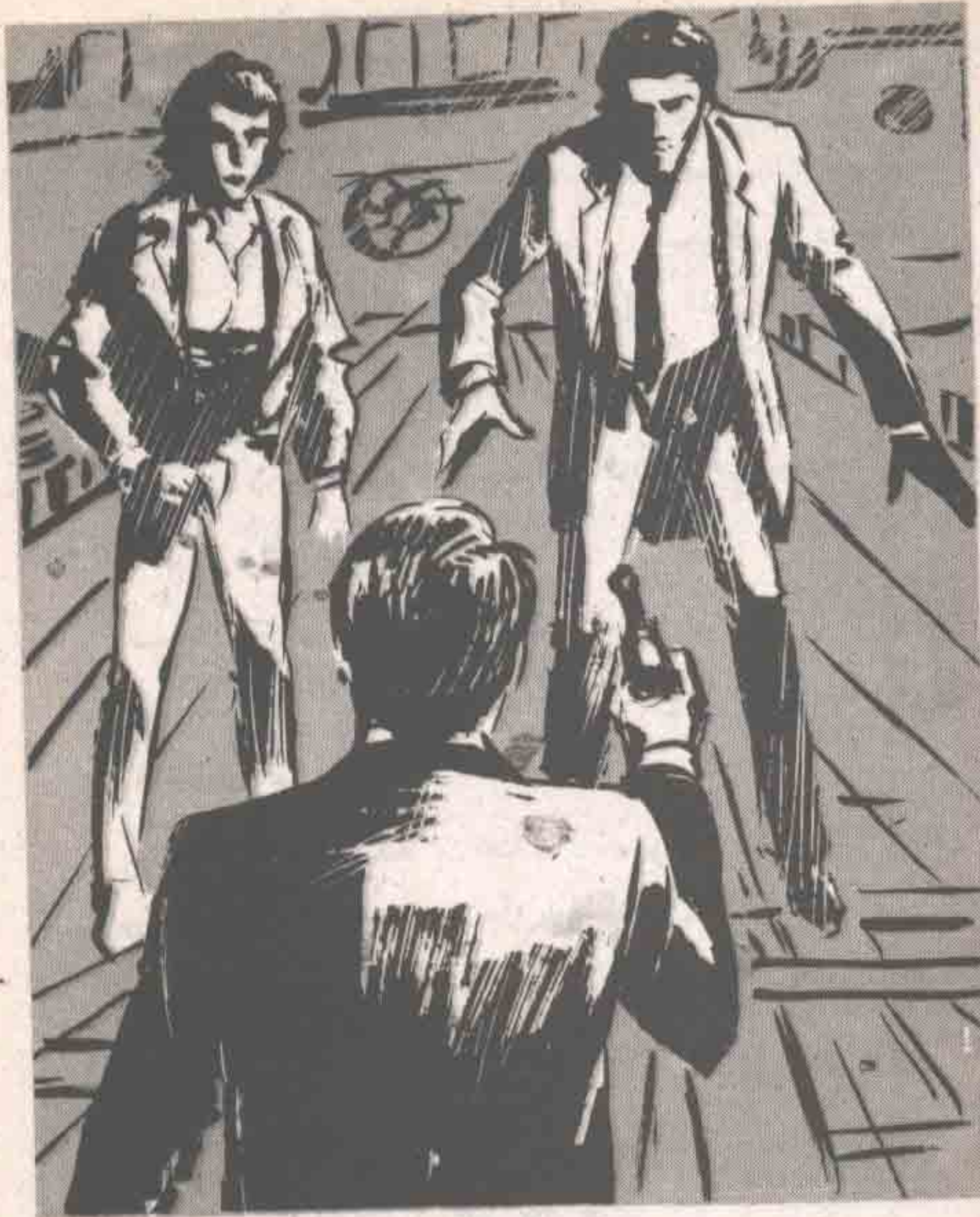
تحركت يد ( هويدا ) بحدة نحو حقيبتها ، ولكنها تراجع بسرعة ، وتظاهرت بالخوف عندما صوب إليهما ( سيمون ) مسدسه ...

قال ( أدهم ) بهدوء : — بكل سرور يا سنيور ( سيمون ) فهذا يتفق مع مخططي تماما .