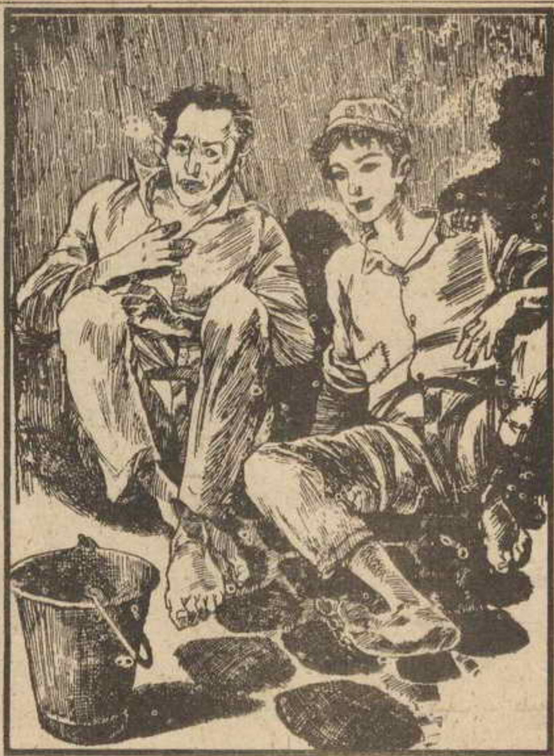
وجلس «عاطف» في التخشيبية وأخذ يستمع إلى حديث «طرزان»

أحس « عاطف » بقلبه يقع في قدميه ، كيف يستطيع البقاء في هذا المكان بضعة أيام ، وماذا سيفعل الأصدقاء