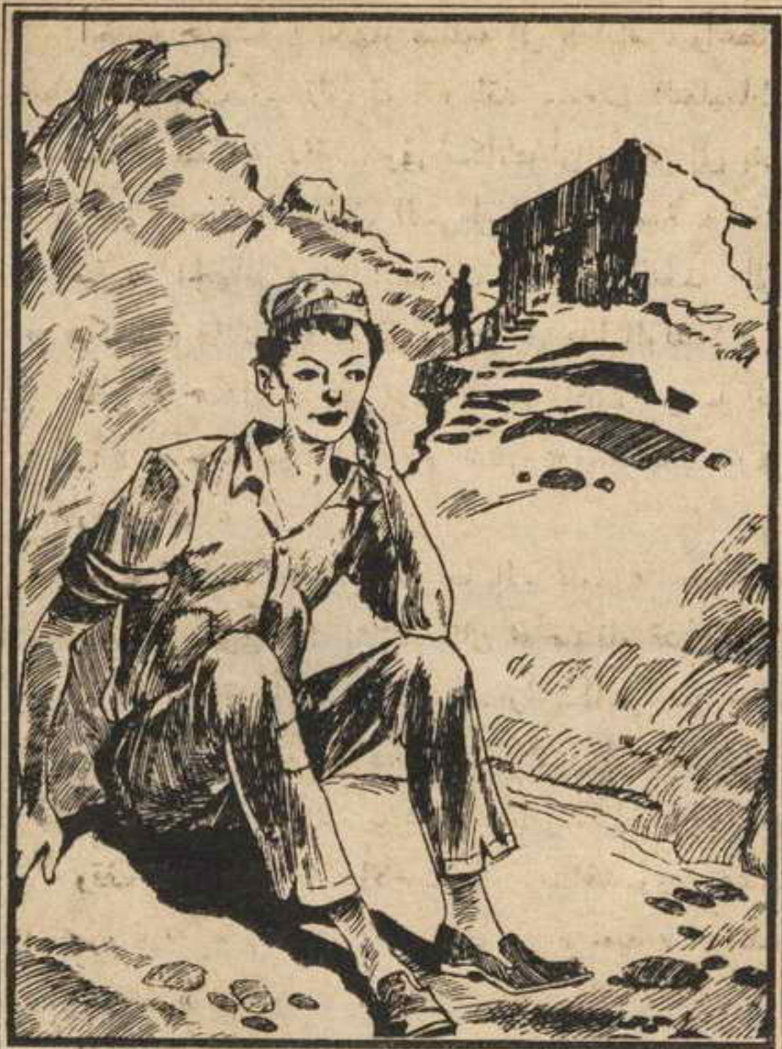
واتجه «لعبه» إلى صخور الجبل، وجلس «عاطف» وحيداً ينتظر

أخذ «حمكشة» الجهاز فسلمه إلى «لعبه» وأعطاه بضعة جنيهات ثم قال له : « لقد سمعت التعليمات وعليك أن تنفذها بدقة .. وفي إمكانك أن تسافر إلى بنها مثلا حتى تبعد عنا رجال الشرطة بمسافة بعيدة » أخذ «لعبه» الجهاز وبدأ ينصرف ولكنه التفت إلى «حمكشة» قائلاً : « وماذا ستفعل في هذا الولد ؟ » . نظر «حمكشة» إلى «عاطف» نظرة مرعبة ثم قال : « سأخذه معي إلى «أبو شنب» ونتخلص منه في المغارة هناك » .