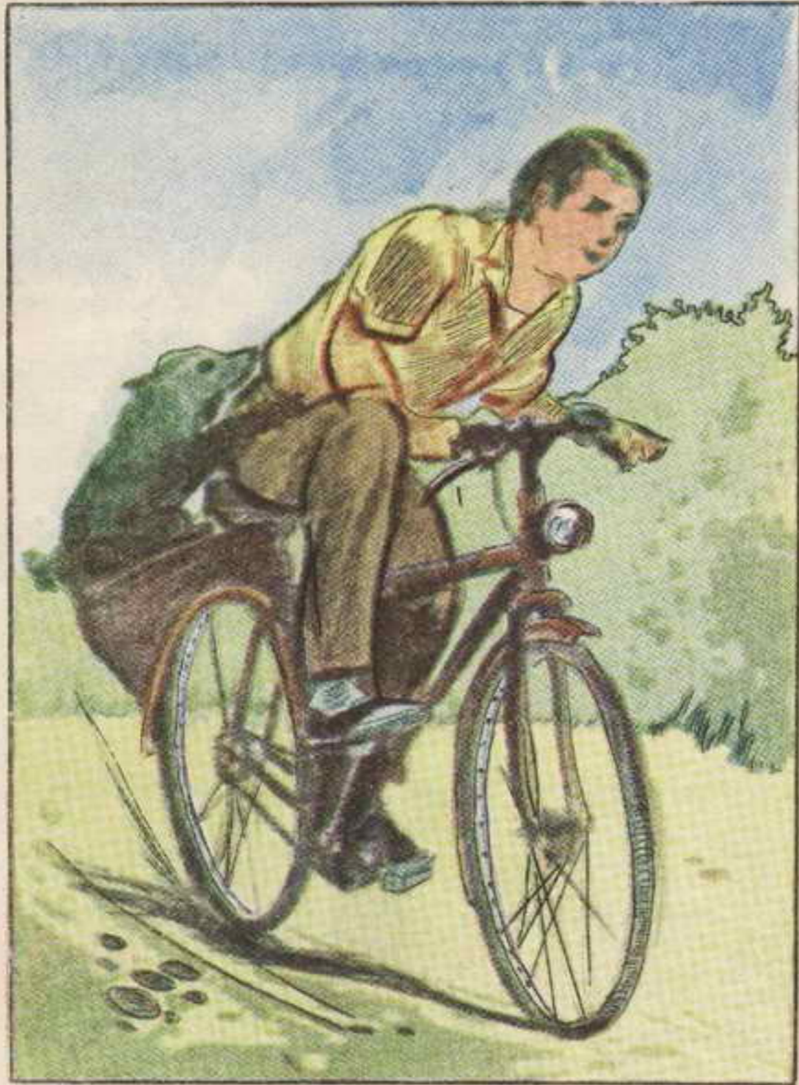
وركب « نختخ » دراجته وأخذ « زنجير » خلفه وانطلق في طريقه .

تذكر « عاطف » كلمة « بزرجى » التى كانت فى الرسالة ومعناها مخبر .. فقال : « لا أعرف .. ولكن لماذا يتبعنى بزرجى ؟ » .