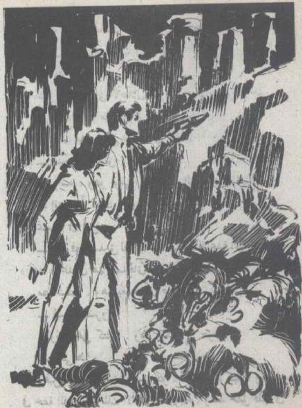
أشار بمسدسه إلى الأطلال القريبة ، وهو يمس في خدر :

لم يكن مظهر ذلك المخلوق ، أو لونه ، هما مثار دهشة ( نور ) ، وإنما ابتسامته الودود ، وتلك الكلمة التي ألقاها بالعربية ، في لكنة عجيبة حينما رأى ( نور ) ، وغمغم :