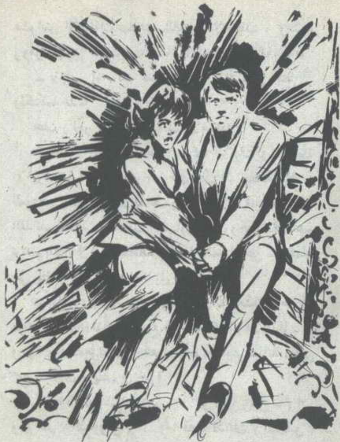
رأى الجميع ( نور ) و ( سلوى ) يعبران من خلال المرأة ، كما لو كانا شبحين عادا فجأة من عالم الموتى ، ويقفزان إلى داخل الحجر ..

تفجرت إثر صيحته هتافات السعادة والارتياح ، واندفع الحاضرون جميعاً نحو ( نور ) و ( سلوى ) ، وانهالت عليهما