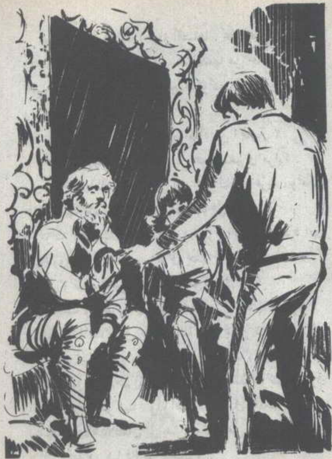
أخرج ( زيمازون ) من جيبه جهازًا صغيرًا ، في حجم كرة ( تنس الطاولة ) ، وناوله إلى ( نور )

لـ ( البيتاروس ) ، في هذه الحقيبة ، وبعده وقع ( چاكوب ) .. هل تذكرين كيف التفت خلفه في ذعر ، قبل أن تنفذ تلك اليد عبر المرآة ، وتقبض على عنقه ، وتجذبه إلى هنا ؟ .. لقد رأى وجه أحد ( البيتاروس ) ، عبر الفجوة ، فظنَّ أنها صورة تعكسها المرآة ، لشيء ما خلفه ، فلمَّا التفت لم يجد شيئًا ؛ لأن تلك الصورة كانت حقيقة أمامه .. ولقد رأى ( دافيد ) ( البيتاروس ) ، وهم يختطفون ( إيزاك ) ، ورأى أحدهم يعبرُ المرآة ، ويحطّم جهاز الالتقاط الحراري ، فأصيب بالجنون من هول ما رأى ..