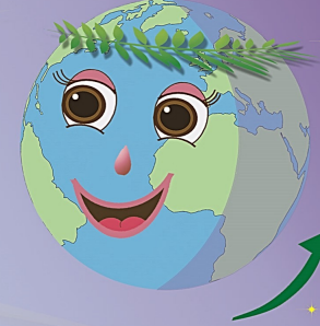
The Night ( اللَّيْل )

وأنا ها هنا في مكاني لا أتحرك لا لا أرحل وأنتَ طَوَالَ اليومِ تُسافرُ معَ الأرضِ تدورُ تُغامرُ جهةً قُرْبِي الآنَ نَهَارُ والأبعدُ لَيْلاً لا تَحْتَارُ هيّا هيّا لتنامَ ... وقتُ الراحةِ والأحلامِ في اللَّيْلِ تنمو تنمو وتُصبحُ كلَّ يومٍ أطولُ هيّا هيّا لتنامَ ... وقتُ الراحةِ والأحلامِ