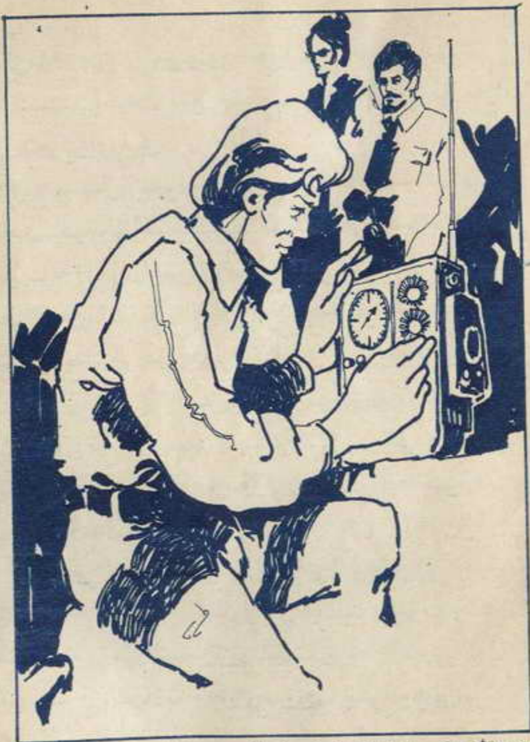
وضع "أحمد" سماعة التليفون ، ثم أخرج جهاز الإرسال ، وبمساعدة برسالة سريعة "عثمان" يخبره فيها أنهم قد أمضوا في الطريق .

قالت « زبيدة » : ( إن « برازيني » لن يظهر هنا مطلقا ، الآن على الأقل ، ولذلك فإن وجودنا هنا ، لن يكون ذا فائدة . يجب أن نطلق لننضم إلى « عثمان » و « مصباح » إنهما في منطقة الأحداث ! ) .