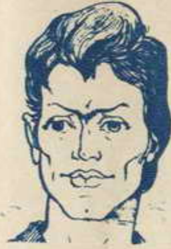
بارازيني أول الخيط