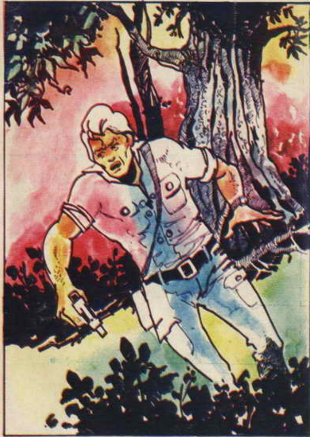
ضغطت زبيدة الزرار ، فأصبحت هناك حلقة حمراء تحيط بالمعسكر ، وسمعوا صوت أحد أفراد العصابة يقول ، الشيران حول المعسكر .

وشرح لهم « أحمد » الأحداث منذ أفرقوا في الخرطوم ، وحتى هذه اللحظة .