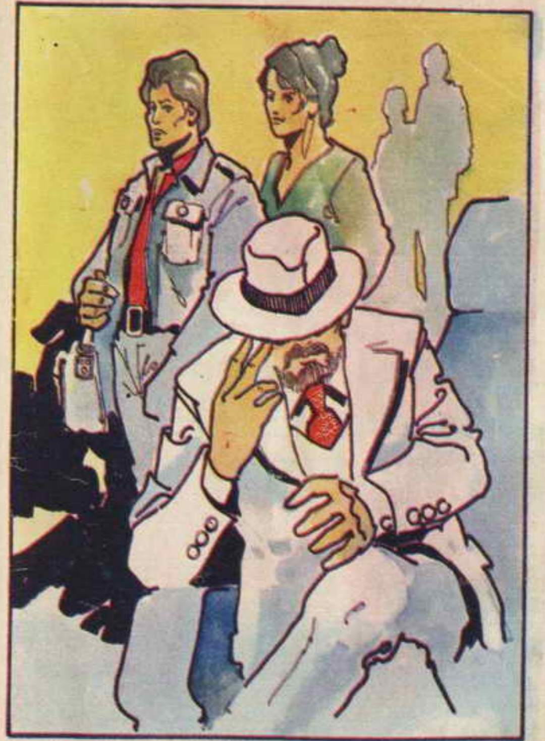
داخل الطائرة لفتت نظر زبيدة رجلين نام وقد أخفى وجهه تحت قبعتها .

لمح « أحمد » الرجل وهو يأخذ حقيبة من فوق السير