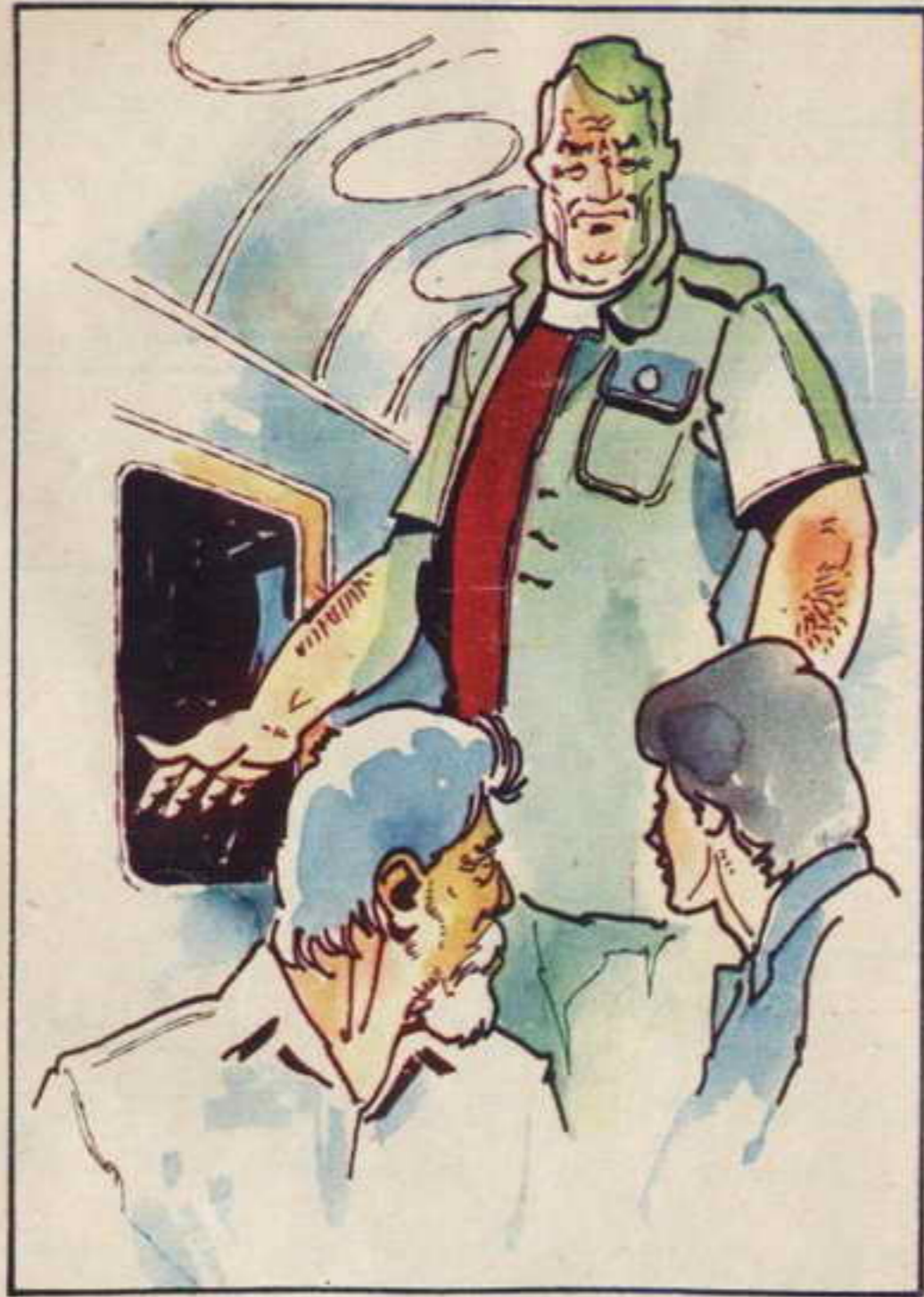
ما أن انتهى أحمد من كتابة عنوان "دان" حتى اقترب منهما رجل منخم الجبهة وقتل: أهلا يا دكتور دان.

ويبدو أن أصوات الرصاص قد أفرقتها فلاذت بالفرار بعيدا عن المكان .