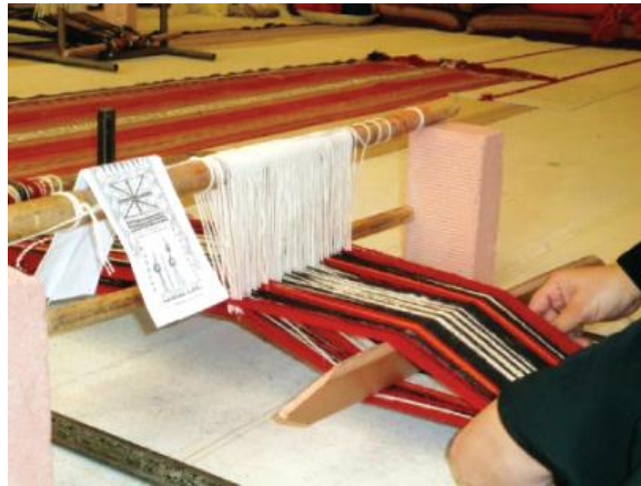
السدو لصنع البسط.