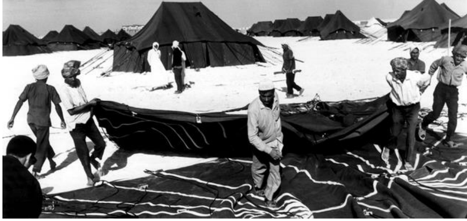
بيت الشعر والرحيل.