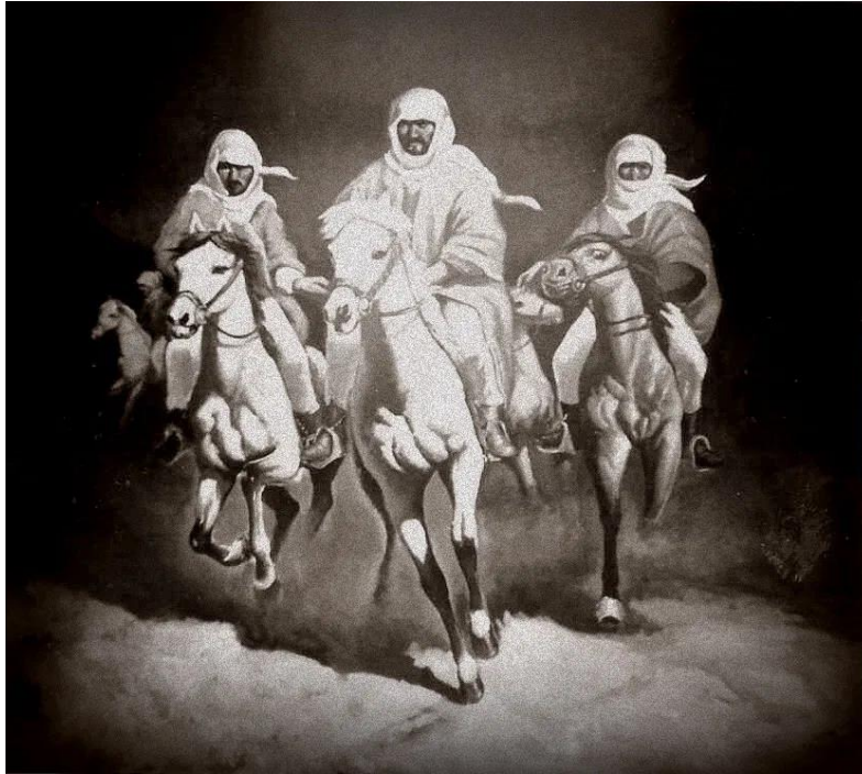
الفرسان أو الخيالة.