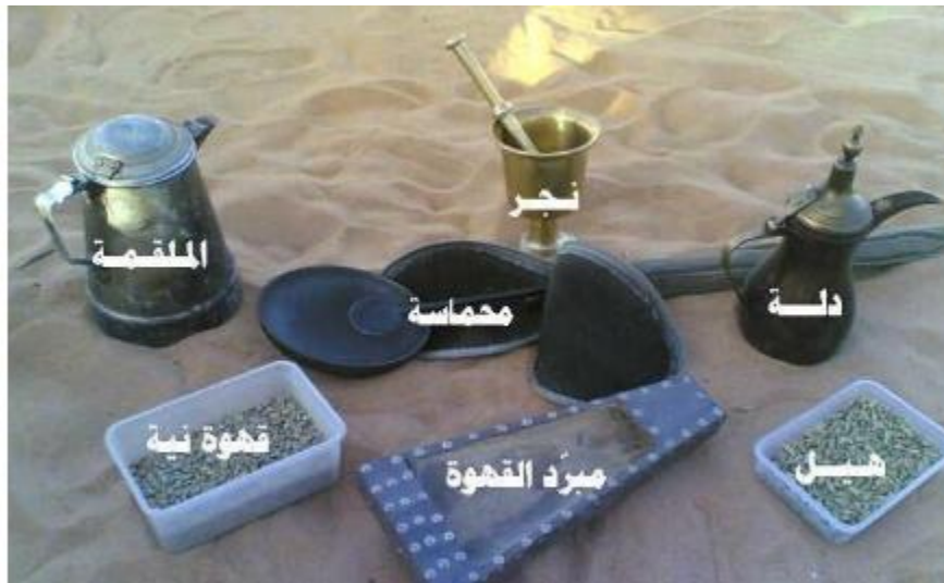
أدوات صنع القهوة الملقمة هي الطباخ.