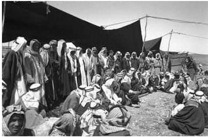
الرجال البدويين (الزلم).