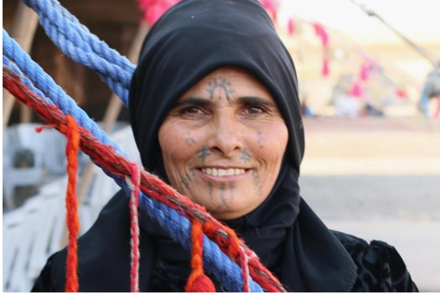
المرأة البدوية وهي لابسة الملقع والعصابة وعاملة الوشم (الدق).