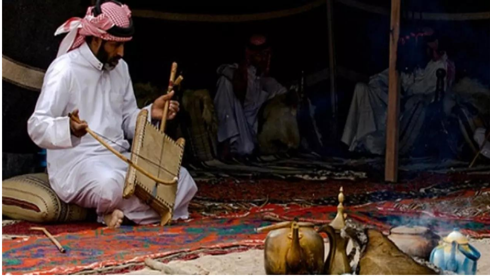
العزف على الربابة.