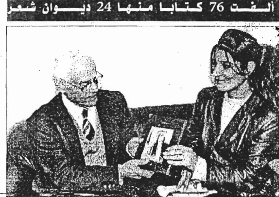
الاجابية هجانا مشاكات مع

تصميم الجيتان في بحور رسول الله احمد قد قلمنا