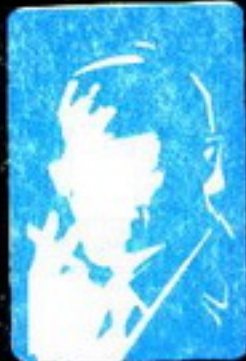
رقم صفر الزعيم الغامض الذي لا يعرف حقيقته احد