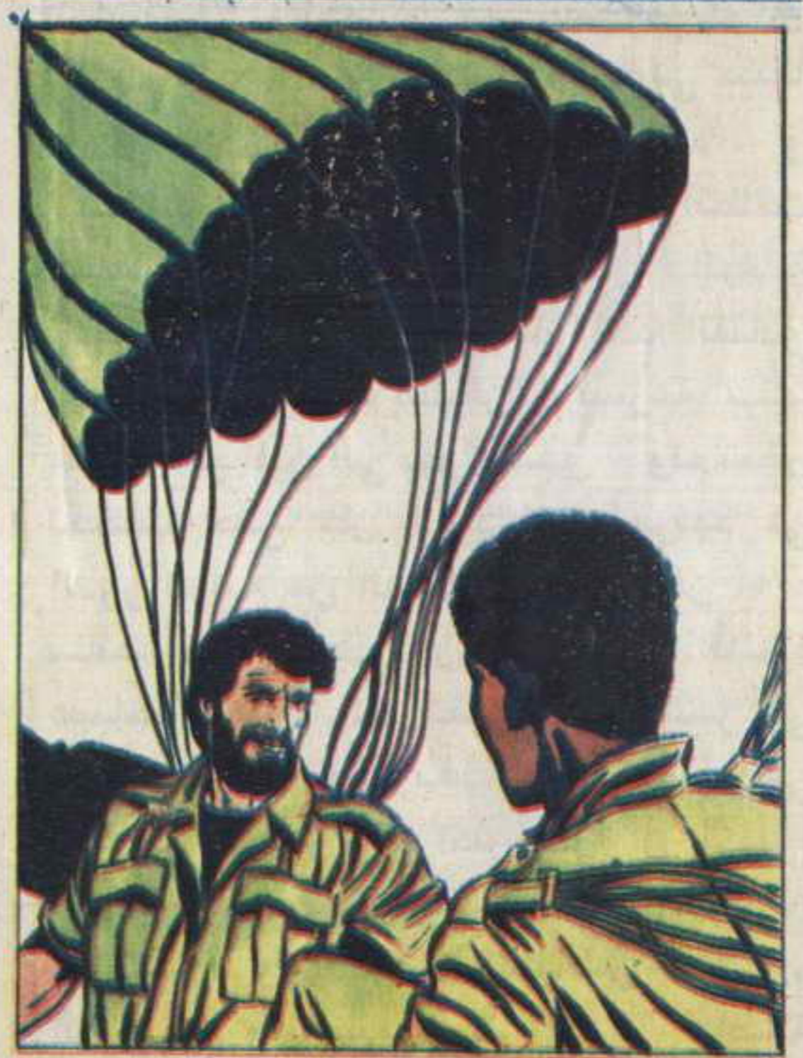
كانت المفاجأة أن يكون ذو اللحية السوداء أو السيد إدوار بينهم وكان يقترب من الشياطين ثم توجه إلى عثمان وهو يتخلص من المظلة .

كانت غرف الشياطين زوجية الأرقام الأولى برقم « ٨٦ » وبها « أحمد » و « فهد » و « باسم » بينما كان « بوعمير » و « عثمان » في الغرفة رقم « ٨٨ » وأخيرا « هدى » و « الهام » بالغرفة رقم « ٩٠ » . استقبل معظم الشياطين ليل « لندن » بالنوم باستثناء « بوعمير » و « عثمان » فقد هبطوا إلى استراحة الفندق ليقضوا بعض الوقت .. كانت استراحة الفندق تعج بالزبائن من هواة السهر .. مع نغمات الموسيقى الأمريكية ويصاحبها غناء للمطرب الأمريكي الشهير « الفيس بريسلي » ملك « الروك » كما يطلقون عليه . جلس « بوعمير » و « عثمان » في ركن بعيد وقد طلبا كوبين من الشاي أحضرهما الجرسون وهو في غاية الغرابة فنادرا ما يسهر أحد الزبائن ثم يطلب كوبا من الشاي .. فمن المتعارف عليه أن معظم رواد