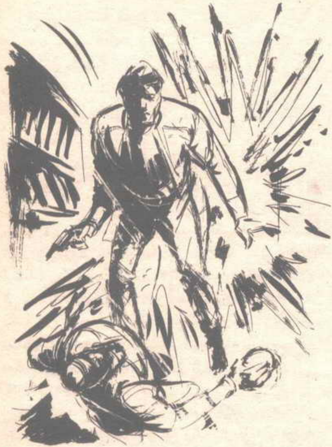
ومع انفجار ذلك الركن وانسحاقه بصاعقة قوية ، وثب (أكرم) ..