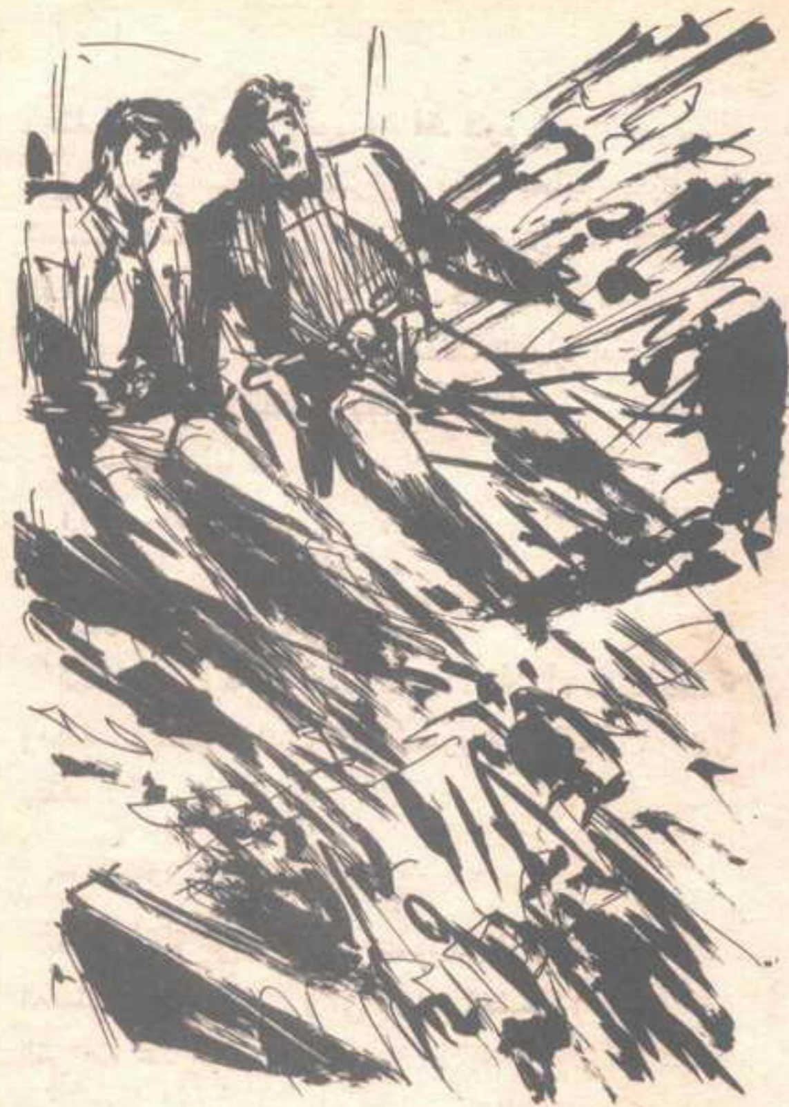
انفجار أطاح بالجدار خلفه مباشرة ، ونسف جسده مع الفراش ..

الوثائق القديمة في الواحات ، واستغرق هذا منه عدة سنوات طوال ، كاد يملكه فيها اليأس ، لولا أن أسفر الحفر فجأة عن العثور على أكثر الوثائق أهمية وخطورة .. تلك الوثيقة التي تتحدث عن الناجين من ( أطلانتس ) .