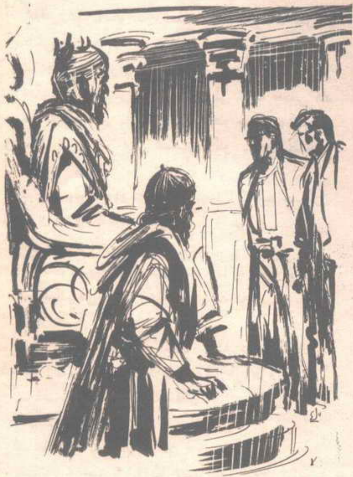
جلس الإمبراطور ( فولار ) على عرشه في مهابة ، وهو يتطلع إلى ( نور ) و ( أكرم ) في صمت ..