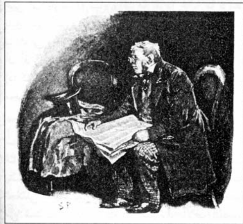
Sydney Paget 1891

نفخ عميلنا الجليل صدره مُظهرًا بعض الكبرياء وسحب جريدة متسخة مجعّدة من الجيب الداخلي لمعطفه الثقيل، وبينما هو ينظر إلى عمود الإعلانات والصحيفة مبسوطة على ركبته أخذت أنفخه، وسعيت - مستخدماً طريقة ريفيقي - إلى قراءة الإشارات التي قد تظهر من مظهره أو ملبسه.