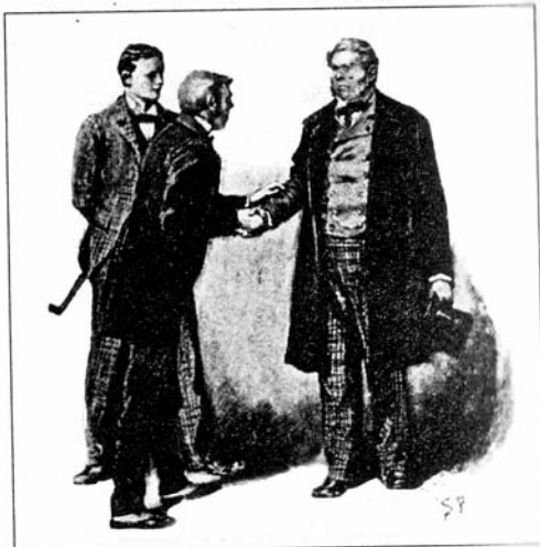
Sydney Paget 1891

فسمعنا أننا محبطين صادراً من أسفل، وبدأ الناس يتحركون في كل اتجاه مبتعدين حتى لم نرَ أحداً