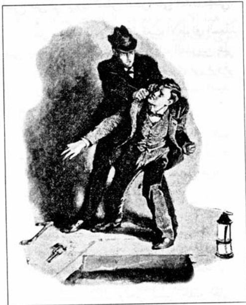
Sydney Paget 1891