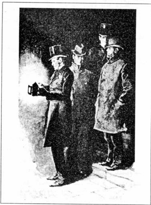
Sydney Paget 1891

قال السيد مريودز وهو يدق بعصاه على البلاط الذي يغطي الأرضية: ولا من الأسفل أيضاً.