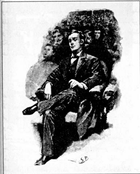
Sydney Paget 1891

هولمز المزدوجة نفسها بالتناوب، فدقته المتناهية وذكاؤه يمثّلان - كما اعتقدت دائماً - ردّ فعل مضاداً لمزاجه الشاعرى ونزعه التأملية اللذين يسيطران عليه من حين إلى آخر، حيث ينقله هذا التقلب في طبيعته من حالة الكسل الشديد إلى حالة من النشاط المستبد.