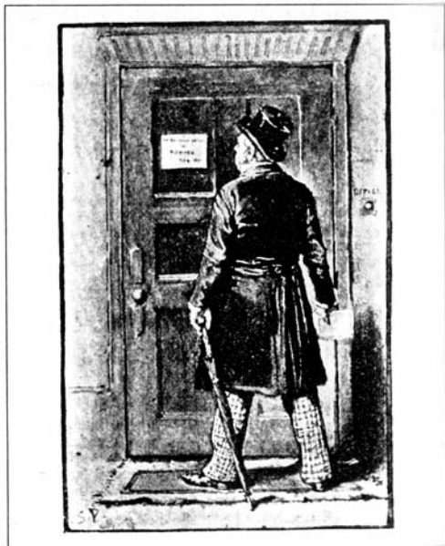
Sydney Paget 1891

المقتضب والوجه الحزين للرجل، حتى تغلب الجانب الهزلي للموقف تماماً على أية اعتبارات أخرى فانفجرنا في عاصفة من الضحك. صاح عميلنا وقد احتقن وجهه حتى جذور شعره المتوهج: لا أرى في الأمر ما يدعو إلى الضحك! إذا لم يكن بإمكانكما