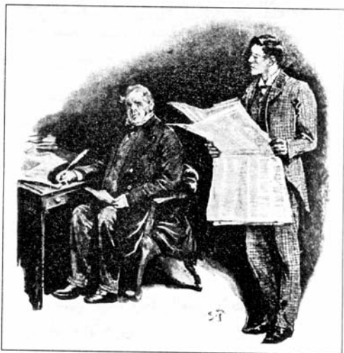
Sydney Paget 1891

قال: لماذا؟ ها هي وظيفة أخرى شاغرة مع جماعة ذوي الشعر الأحمر، وهذا يعني ثروة صغيرة لمن يحظى بتلك الوظيفة. وقد عرفت أن الوظائف