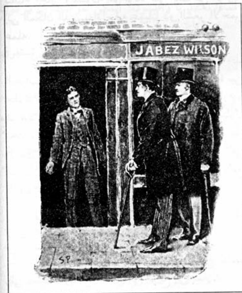
Sydney Paget 1891