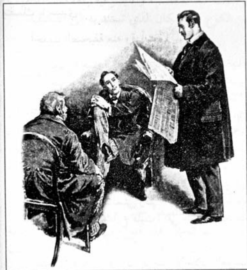
Sydney Paget 1891

قهقه هولمز وتلملم في كرسيه كعادته عندما تكون معنوياته مرتفعة وقال: الأمر خارج عن المألوف، أليس كذلك؟ والآن يا سيد ويلسون، اترك هذا الأمر وعُدْ إلى البداية لتخبرنا بكل شيء عنك وعن الأفراد المقيمين في منزلك وعن تأثير هذا الإعلان على ثروتك. أرجو - يا دكتور واطسون - أن تسجل أولاً ملاحظة عن الصحيفة وتاريخها.