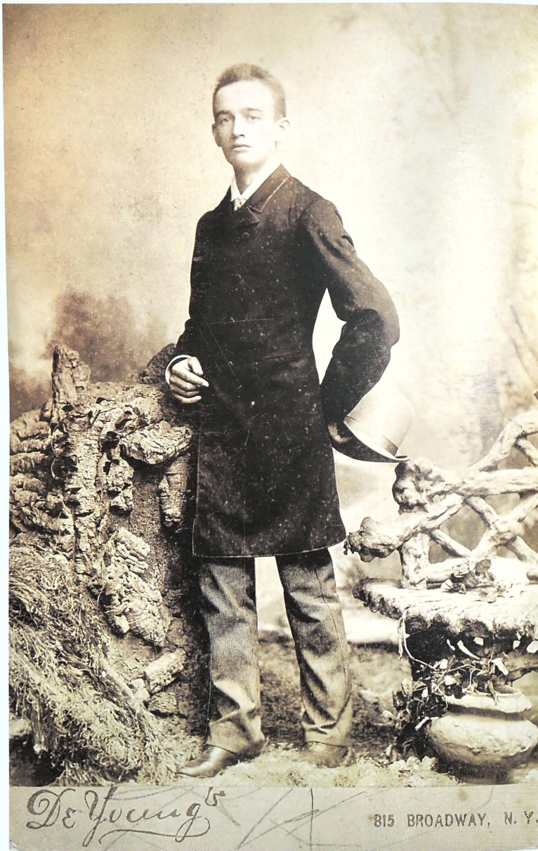
هاجر فريدريك ترامب، جد دونالد، إلى مدينة نيويورك في السادسة عشرة من عمره، وانتقل إلى الغرب حيث ازدهر عمله خلال مرحلة فورة الذهب قبل أن يعود إلى نيويورك ليؤسس عائلته.