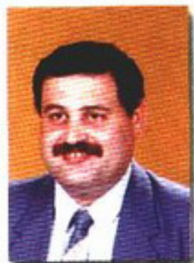
د. نبيل فاروق