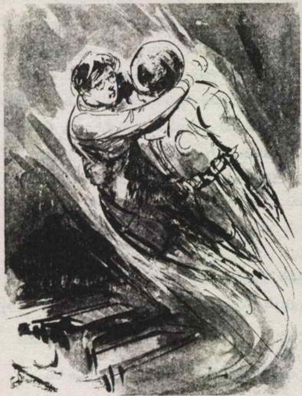
ألقى (سيف) السؤال في اللحظة نفسها ، على مسامع الدكتورة (فاتن) ، وهو يطير بها مبتعداً ..