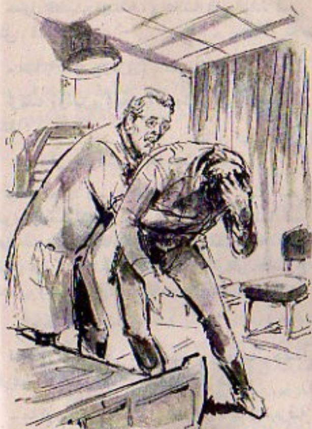
فكاد يانهار أرضاً ، لولا أن تشبّث بطرف الفراش . فأسرع الطبيب يعاونه على التماسك ..