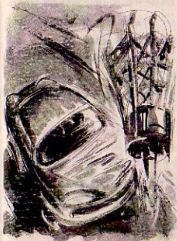
وفي نفس اللحظة التي استقرت فيها على الطريق ، انقضت عليها قملة البرج المحطم ..

- من الواضح أنه قد أسقط برج البث الرئيسي ، لجريدة ( أبناء الفيديو ) ، والذي كنا نستخدمه للبث العام ، ولكن نظام البث ، الذي نستخدمه داخلياً ، مازال يعمل بكفاءة ، لذا فنحن نستقبل موجاته بوساطة الهوائى الخارجى فحسب .