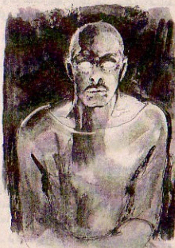
ومع اختمار ذهنه بالفكرة الشيطانية ، تضاعف تآلق عينيه أكثر .. وأكثر ..