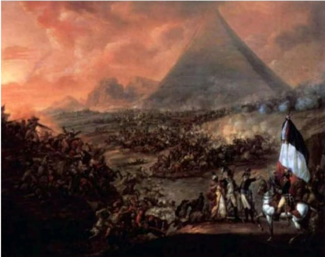
لوحة «معركة الأهرام» أو إمبابة الأهرامات بريشة فرانسيز لويس جوزيف سنة ١٧٩٨م