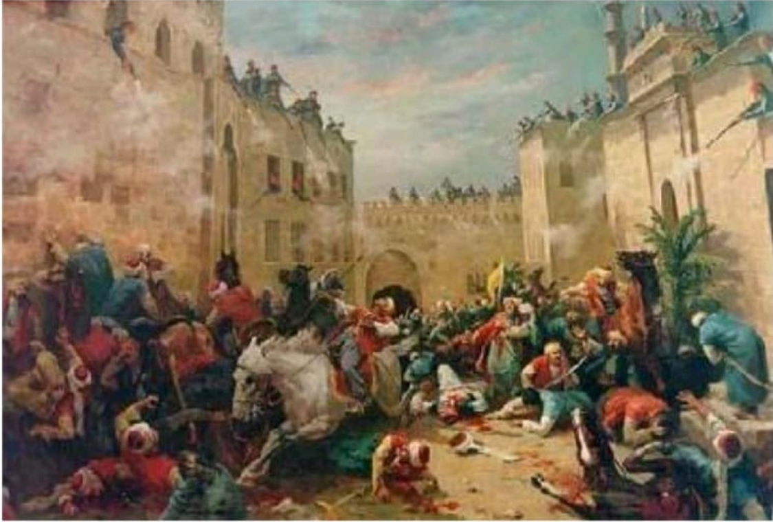
لوحة تخيلية لمذبحة القلعة

بعد خروج جيش نابليون من مصر العام ١٨٠١م رسميًا، وبعد مقاومة شعبية من المصريين وزعمائهم الشعبيين وقلوب المماليك، وبعدما هزم نابليون في واترلو وأبو قير البحرية، تحررت مصر أخيرًا من سطوة الاحتلال الأوروبي لفترة من الزمن، وحين غادر آخر جندي فرنسي من الأراضي المصرية، أصيبت مصر بحالة من الفراغ السياسي، فالكرسي العثماني أصابه الوهن، والمماليك يلملمون جراحهم في استعداد لاستعادة الملك، والمصريين يكرهون الفريقين. كان المصريون في تلك الفترة ينتظرون قرار السلطان العثماني بإرسال والي جديد ليحكم مصر، كانت مصر وقتها لها زعيمان هما عمر مكرم نقيب الأشراف والشيخ عبد الله الشرفاوي، وهؤلاء قرروا انتظار قرار السلطان العثماني سليم الثالث. أما عن المماليك فقد كان الخلاف بينهم على أشده، منقسمون تحت