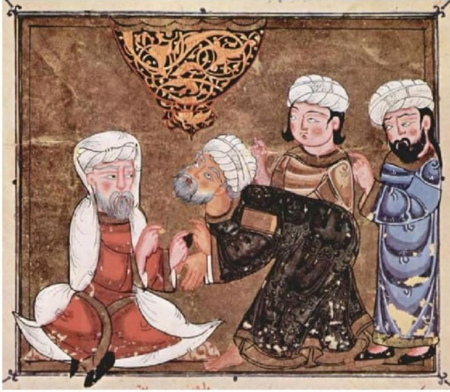
رسم من سنة ١٣٣٤م، أي خلال العصر المملوكي، يُظهر رجلاً في حضرة قاضي مَعْرَةَ النُّعْمَانِ.