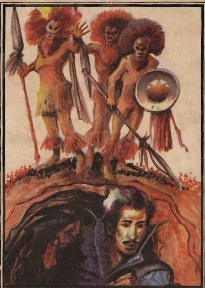
قال ممدوح في استسلام : لقد وقعنا في أيديهم ولا سبيل أمامنا إلى الفرار !

و«سلمان» ، بعد أن خرجا من مخبئها ، وانضمّا إليه دون أن يشكّ فيهما أحد ! . . . كانا كأى واحد منهم ، دون أى فرق أو تمييز !