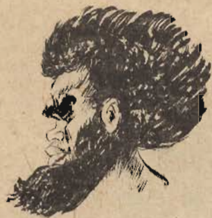
زعيم القبيلة الصفراء

لم يُسمح لأحد بدخول المعبد هذه الليلة ، ووقف الحرس بحرايهم الطويلة يسدّون مداخله . وفي انتظار ساعة الصفر كان المغامرون يشاهدون في الساحة عجباً ، حتى كادوا يفقدون أعصابهم ! ..