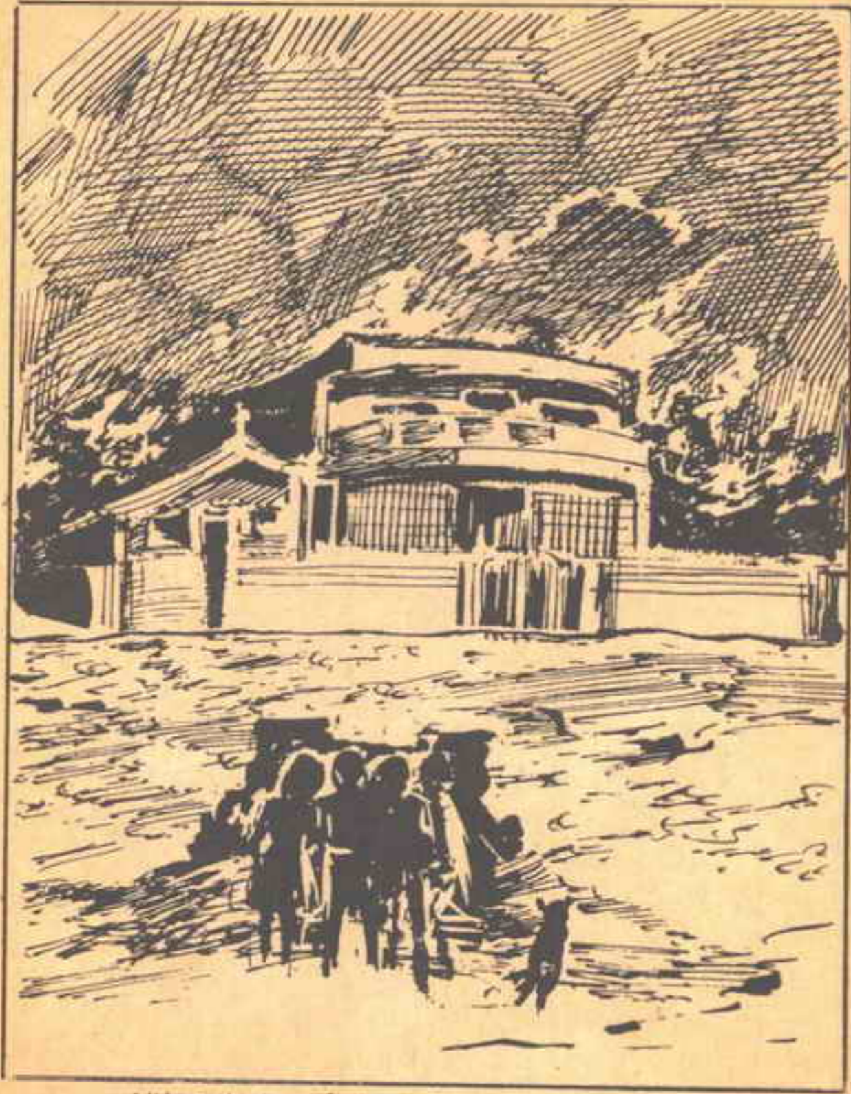
كانت الطاية وملحقاتها هي الموقع الوحيد الذي يكشف لهم الفيلا الخالية