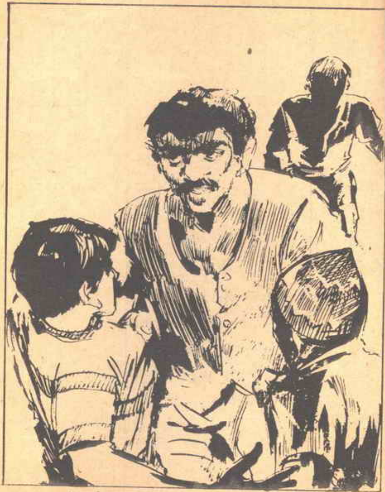
هجم عليها «حميدوه» وأمسك بتلابيبها وأخذ يبرها هزاً عنيفاً.

هذا القرار إنقاذ حياة مصاب جريح ، أو إطلاق سراح أسير ! ! . . أوقد يكون العكس ! وقوعهم في مأزق حرج لا مخرج لهم منه ! ! . .