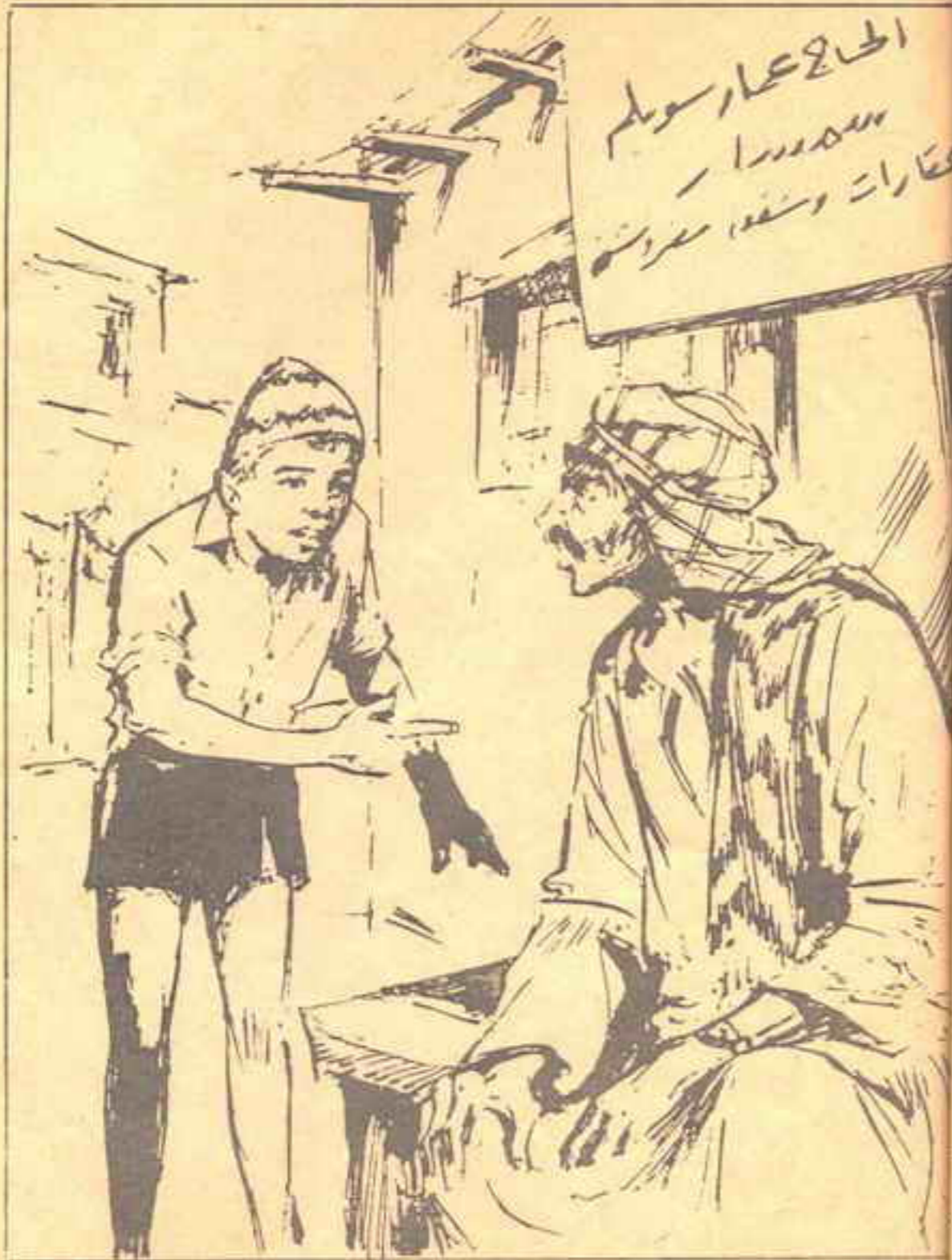
كان السمسار يجلس على مقعد بجوار اللوحة ، فنظف إليه «سمارة» فوجده أعرابياً .

فوجده أعرابياً . ففرح بهذا الاكتشاف فقد توسم فيه خيراً ، فهو أعرابي مثله ، ربما تعاطفا وتفاهما !