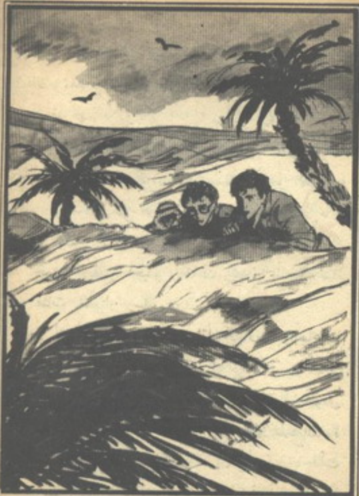
وارتغوا سريعاً على الأرض عندما سمعوا صوت الرصاص يمر بجانب آذانهم

تنزل حتى لا يستطيع أن يرفعها من ثقل الرمال .. والساعات تمضي والحرارة تشتد . والشمس ترسل لهبها فوق رأسه .. وتساءل كيف يعيش هؤلاء الناس هنا يقضون العمر كله في مثل هذه الحياة وشعر بالإعجاب الشديد بهم لهذه القدرة العظيمة ، وفجأة تنبه من أفكاره إلا أن الأرض قد بدأت تنبسط تحت قدميه والحشائش تنحدر متناثرة في أول الأمر ثم