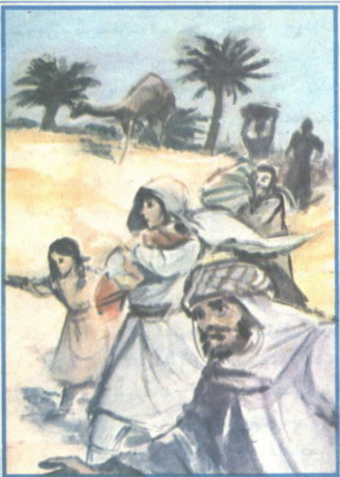
كانوا مجموعة من الأسرى . شيوخا وشبابا وأطفالا . وكلهم يجرّون وهم يحملون أحمالهم .