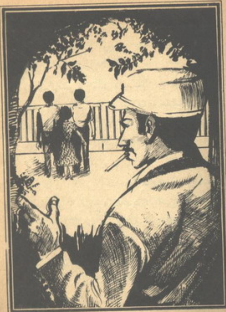
ودعهم المفتش حمدى متسماً .. وأخذ يفكر وهو ينظر إليهم وهم يتعدون

وأما عن تفتيش حجراتهم فسوف أتصل بإدارة الفندق