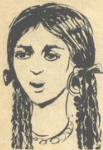
ذات العيون الواسعة

في الصباح الباكر .. بعد الفجر مباشرة .. بدأت الرحلة ، كان هذا هو الموعد الذي اتفقوا على بدء رحلتهم فيه ففي هذا الوقت يكون الجو رقيقاً والهواء مازال بارداً ولم تشتد الحرارة أو تسطع الشمس بعد ، وحتى يمكنهم