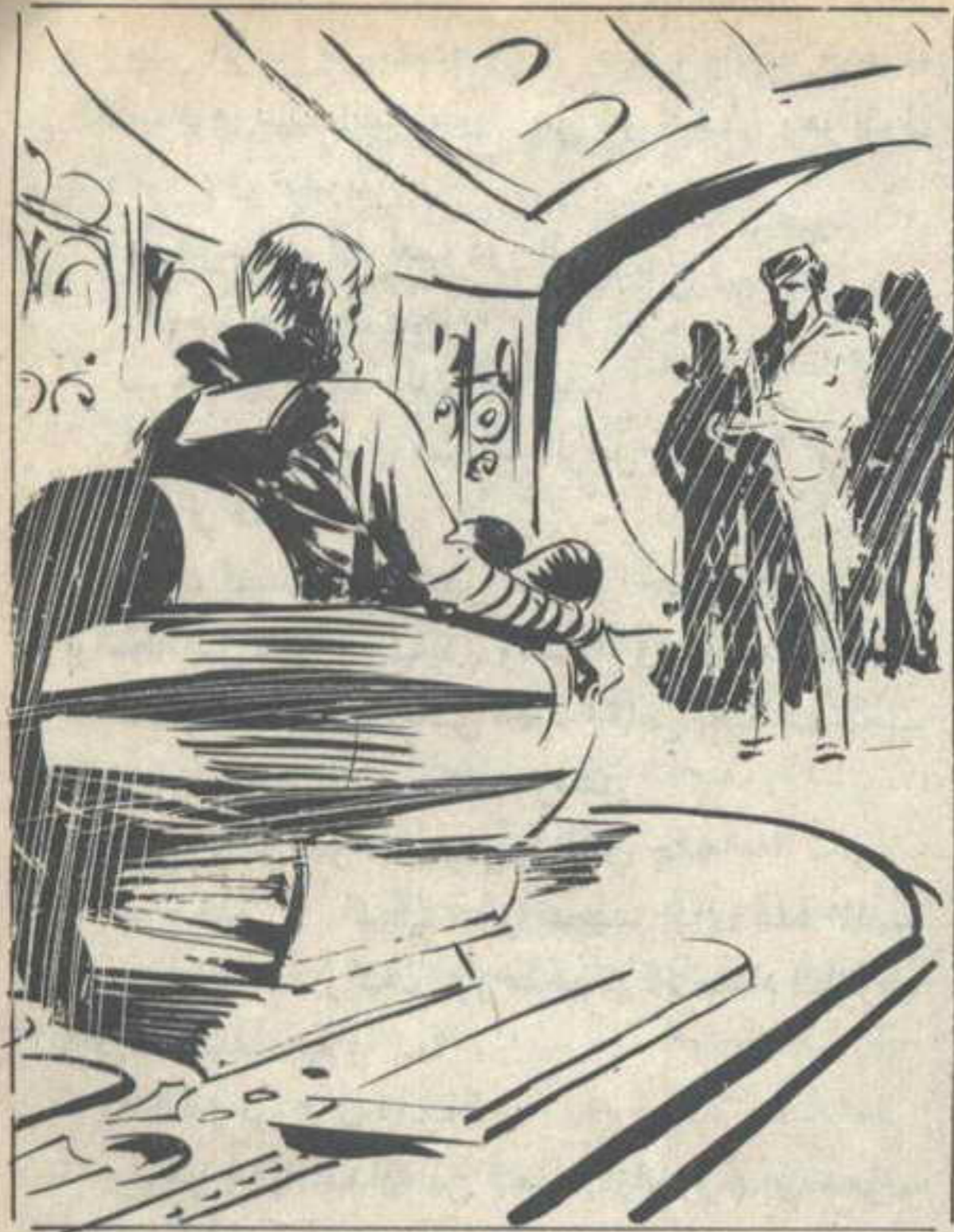
قاطعه ( نور ) في صرامة : — بل ( سيّد الكاذبين ) أيها المنافق ..

بعده لتؤدى عملها في كفاءة ، تمامًا كمقاتلكم الآلى ، الذى أسرته داخل سجن من أقوى معادن ( زاندر ) ، وأشدّها صلابة .