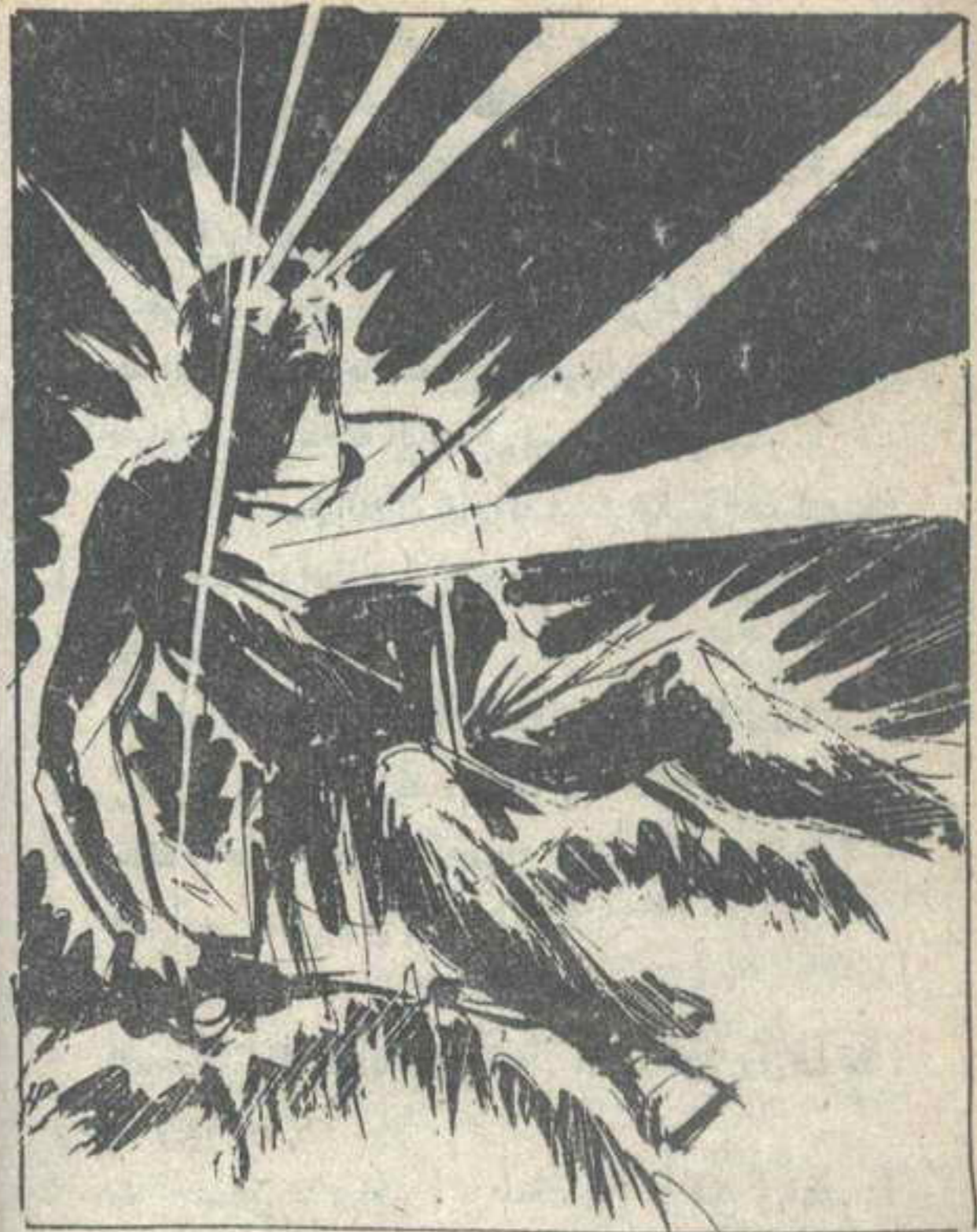
وأصابت خيوط الأشعة البنفسجية الثلاثة صدر ( س ١٨ ) في ضربة قوية ، دفعته إلى الخلف في عنف ..

أشار ( نور ) بسبابته ، وهو يقول : — خطأ يا ( رمزي ) .. هناك فتحة يمتد منها بساط مخمل ، سار فوقه الدكتور ( وحيد ) إلى قلب ( المدينة الأم ) .