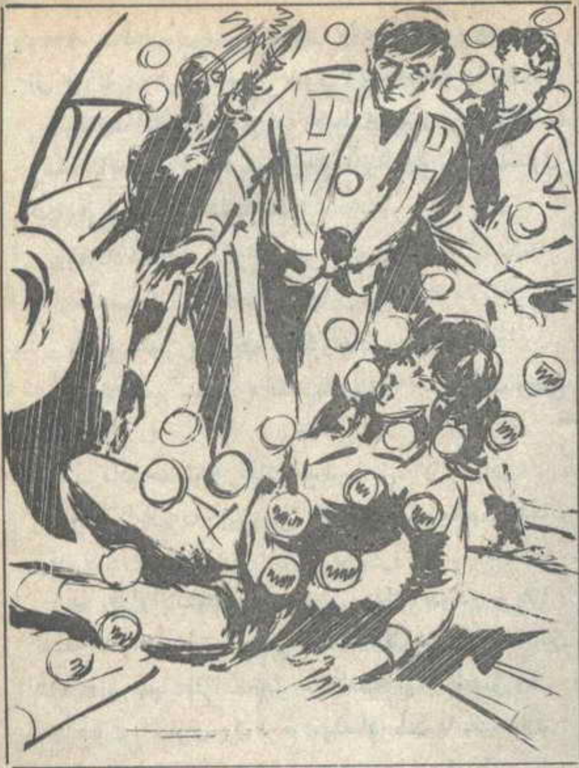
وسقطت ( سلوى ) محاطة بعشرات الفقاقيع الذهبية اللزجة ..

فقاعات ذهبية ، برّاقة ، شفافة ، تندفع في سرعة مخيفة .. وانطلقت أشعة الليزر من عيني ( س ١٨ ) ، لتفجّر الفقاعات واحدة بعد الأخرى ، في سرعة وتتابع وإتقان .. وأسرع ( نور ) ينتزع مسدّسه الليزري ، ويحذو حذو ( س ١٨ ) ، على الرغم من دهشته ، وعدم فهمه لمدى خطورة هذه الأشياء ..