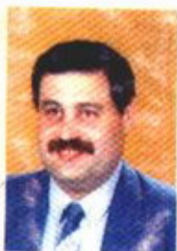
د. نبيل فاروق