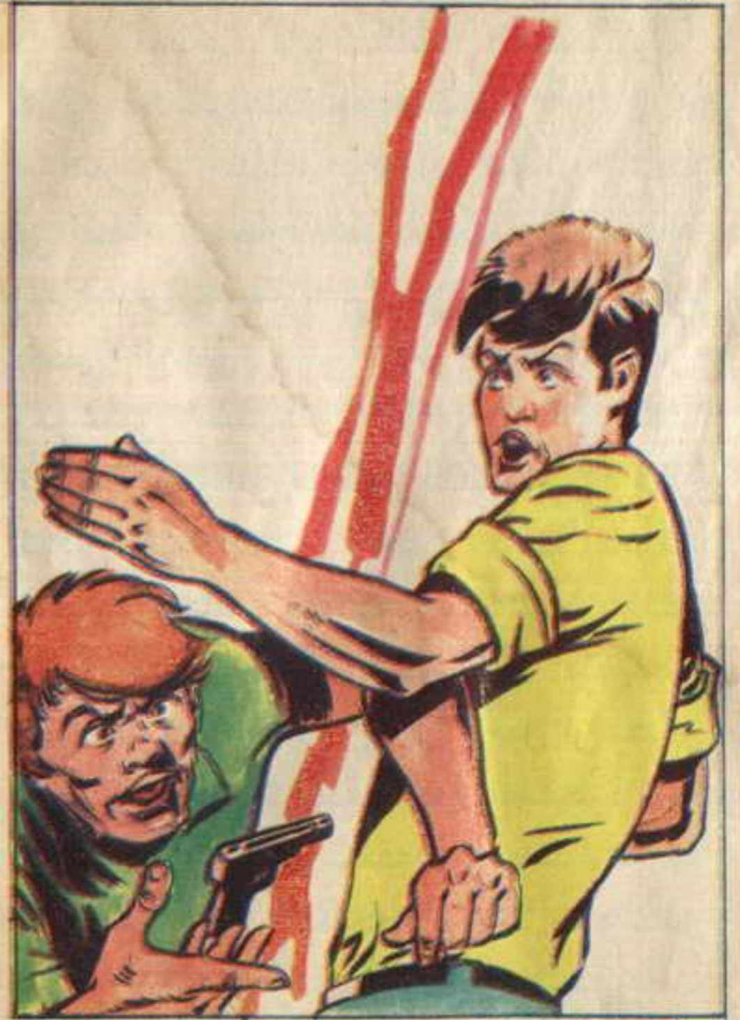
فجأة كان الشياطين قد نزلوا الساحة ضربوا بوعيمير أحد العناصر من ضربة مفاجئة أطارت المسدس من يده ..