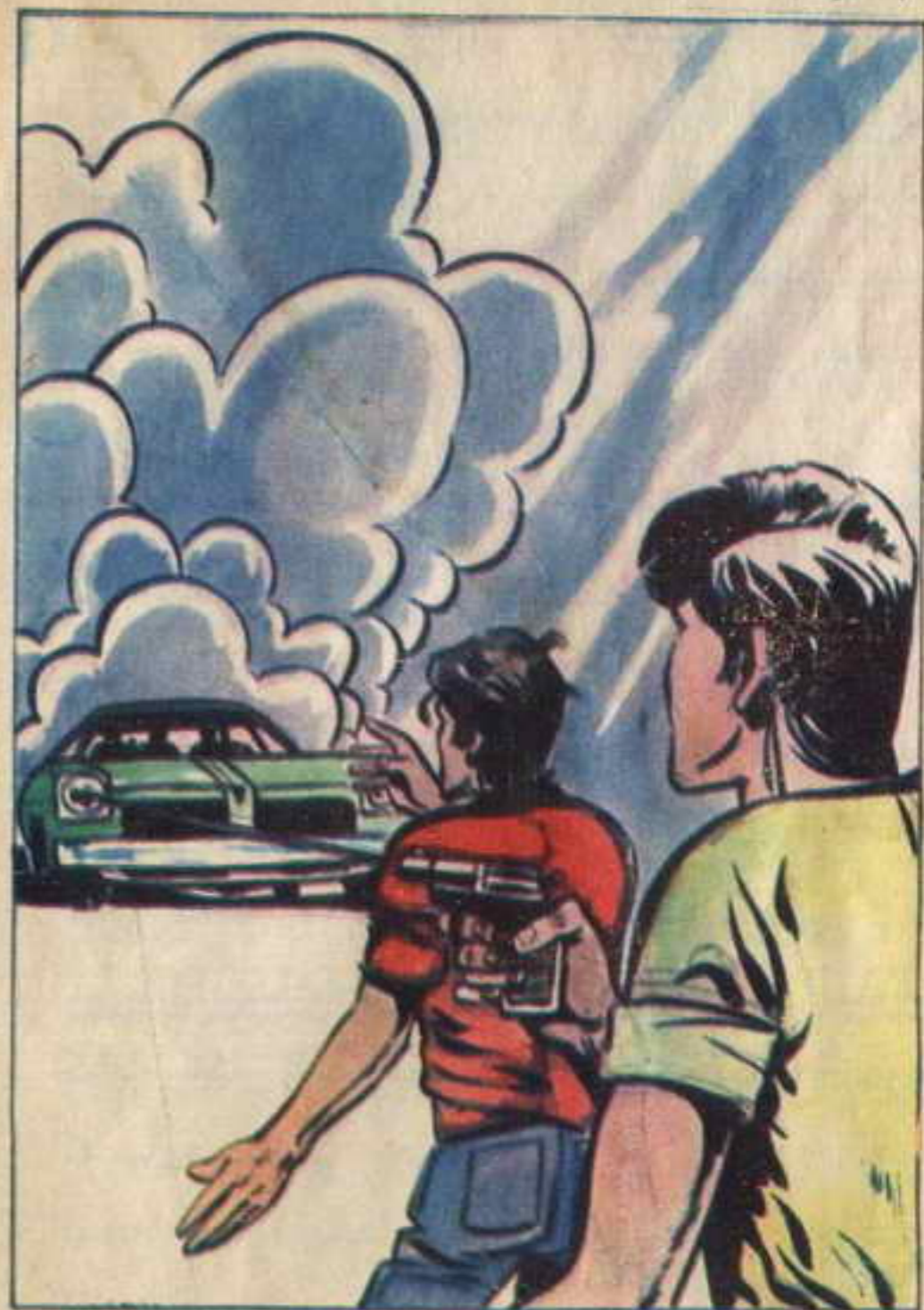
أسرع أحمد فكدت قنابيل الدخان في اتجاه السيارة التي كانت تتقدم ببطء ..