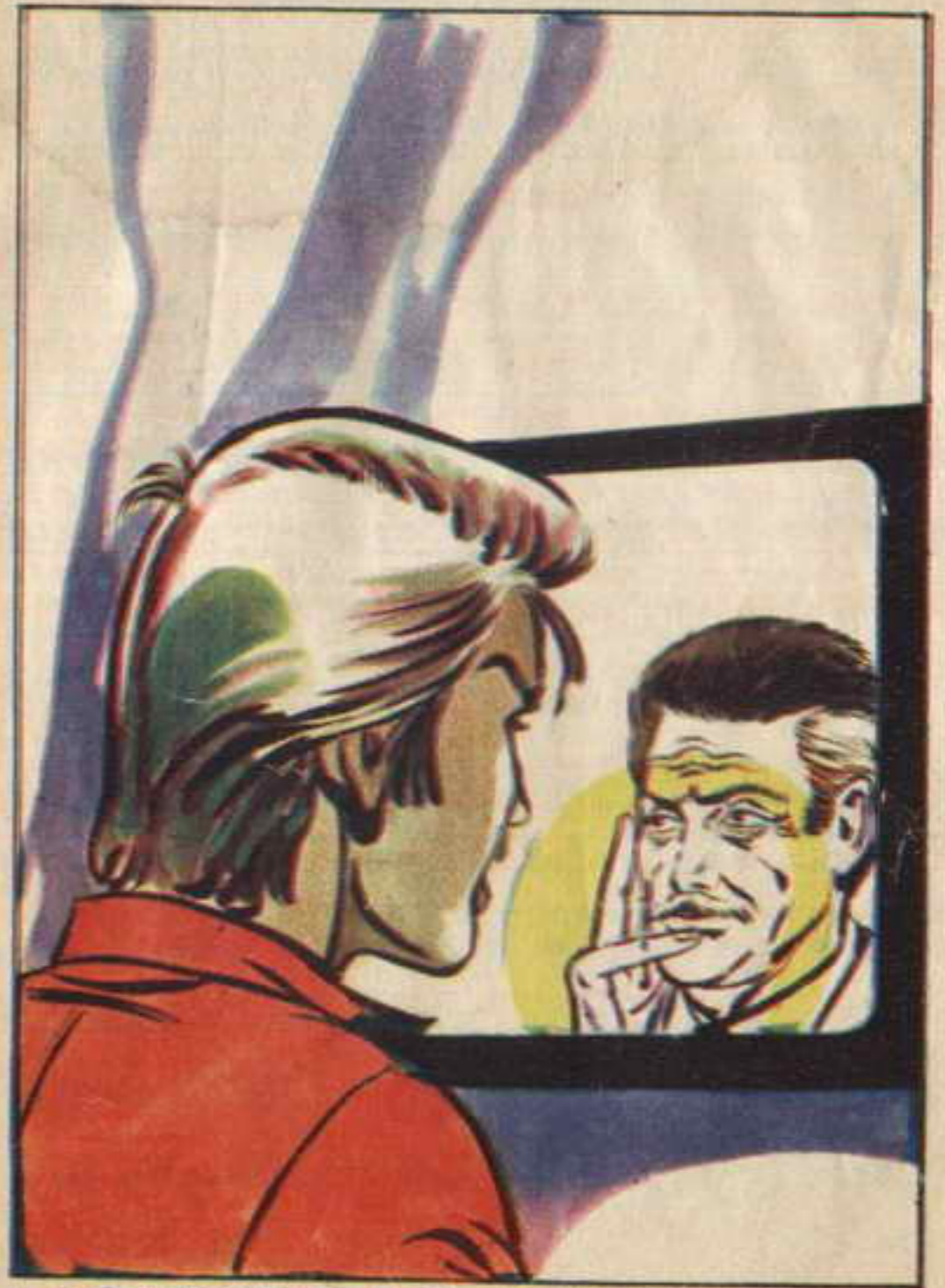
لم تبرز لحظات ، حتى ظهر " ليتل مان " على الشاشة كان تماما كما وصفه راقم " صفر " .

عاد « أحمد » الى كرسيه وجلس .. فجأة ، انتهى فيلم « ليتل مان » .. ثم ظهرت خريطة لوسط أوروبا .. وتحددت « تشيكوسلوفاكيا » ، و « ألمانيا » .. وظهرت مقاطعة « بافاريا » الألمانية ، ثم غابة « بوهيميا » التي تقع على الحدود بين تشيكوسلوفاكيا وألمانيا .. وهي غابة كثيفة الأشجار .. وفيها يرتفع جبل « أربير » إلى ١٤٥٨ مترا ، كما اشارت الخريطة .. ظل « أحمد » يرقب الخريطة وتفاصيلها ، ثم قال في نفسه : « لابد أن المغامرة تدور في غابة « بوهيميا » فهي مكان يصلح كثيرا للمغامرات .. كما أنها يمكن أن تكون مكانا