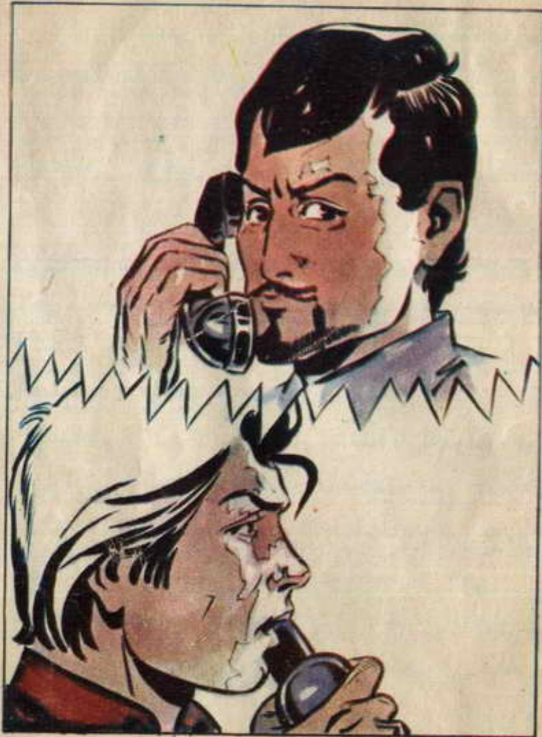
استيقظ أحمد مبكراً على صوت رنين التليفون وعندما رفع السماعة جاءه صوت خالد يقول: «ألن تبدأ يومك مبكراً؟»

منهم وحتى لو رآني فلن اتحدث اليه .. وعندما انتهى من قراءة الدراسة أخذ يجهز ما يريد .. الآلة الحاسبة الصغيرة والتي أدخلها المقر السرى فى الأجهزة الحديثة التى يستخدمها الشياطين .. قلم صغير ، قد لا يلفت نظر أحد ، لكنه يستخدم فى أشياء كثيرة ثم جهز حقيبته السحرية .. وعندما أطمأن لكل شىء .. ألقى نفسه على الفراش ، واستغرق مباشرة فى النوم .. غير انه استيقظ مبكراً على صوت رنين التليفون .. وعندما رفع السماعة جاءه صوت « خالد » يقول « ألن تبدأ يومك مبكراً ! »