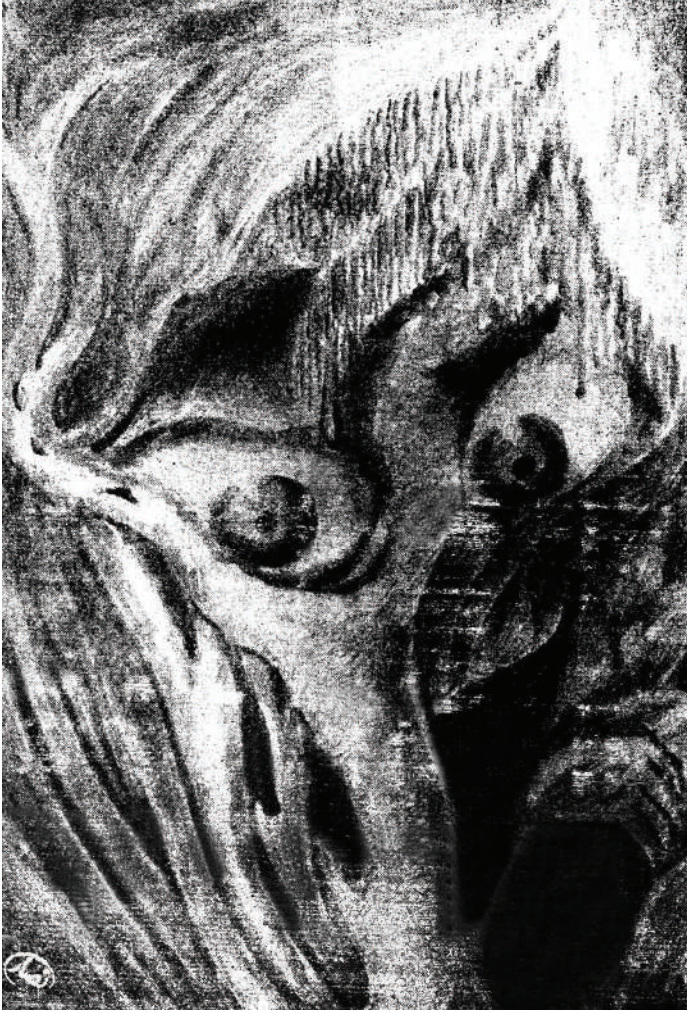
طعبروس إله الغلو والادعاء.