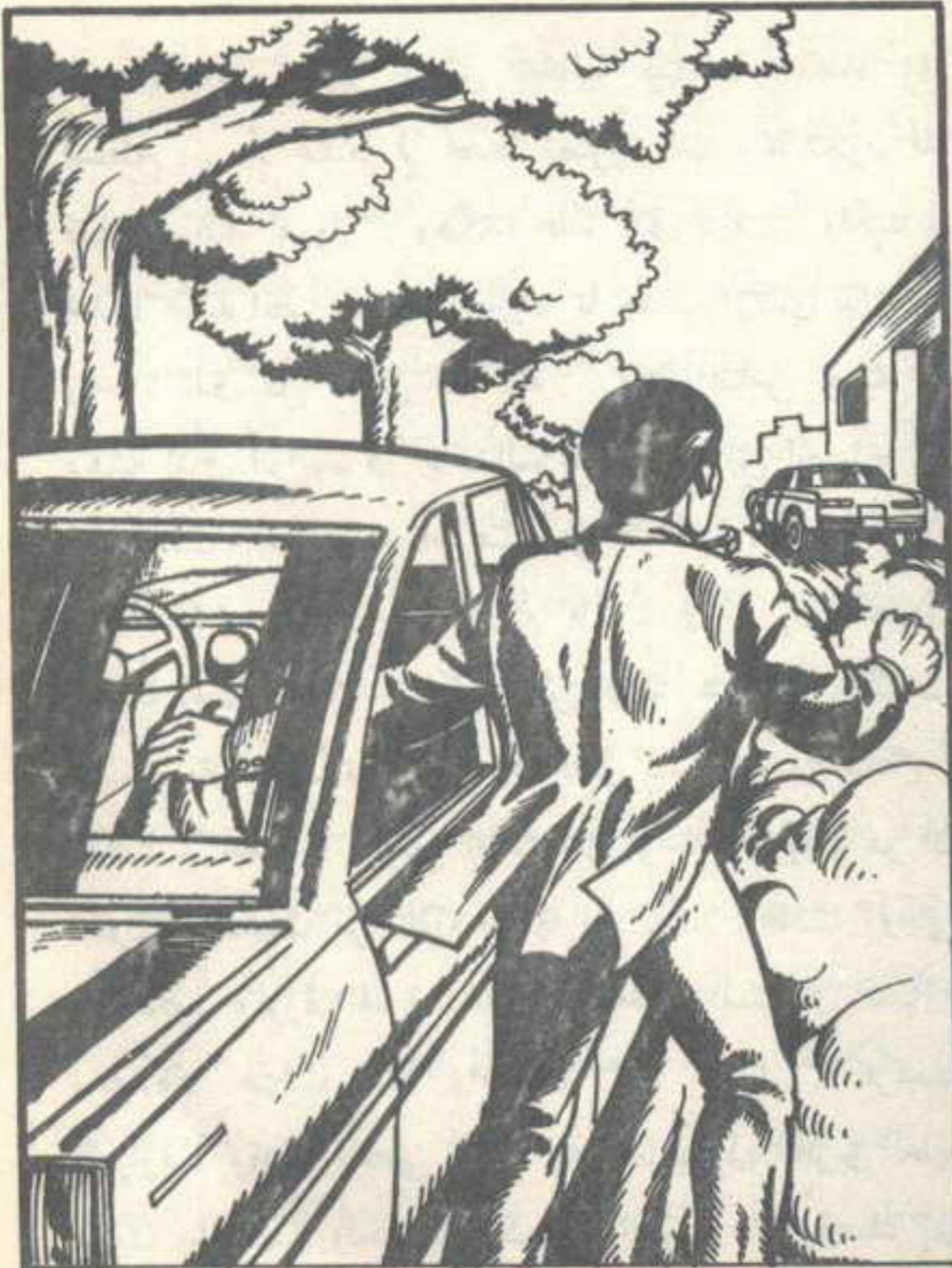
انطلقت سيارة رمادية اللون بسرعة من الجانب الأيمن حيث تركت سيارتي

وسأل «المفتش» : هل بحثتم في العمارة نفسها ؟ عاد «الوالد» يتنهد وهو يقول : بالطبع ، دخلنا العمارة ،