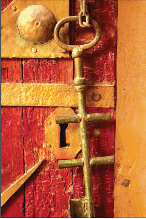
صورة لمفتاح أحد أبواب الحارات التي هدمها الفرنسيون

إليهم أفراجاً، فنططن الحيطان، وتسلقن إليهم من الطبقان، ودلوهم على مخبات أسيادهن وخبايا أموالهم ومتاعهم وغير ذلك».