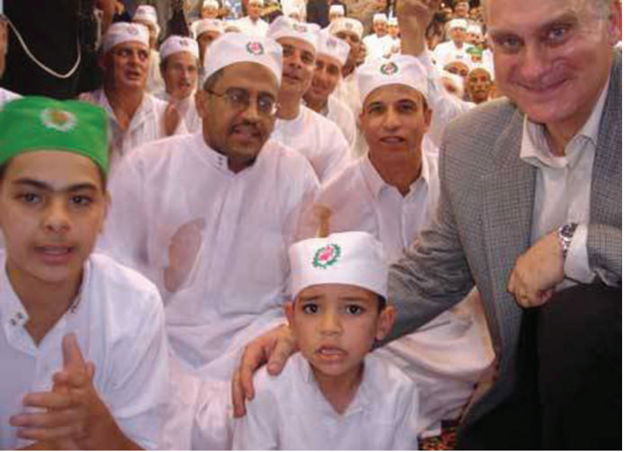
السفير الأمريكي ريتشارد دوني يشارك الطرق الصوفية احتفالها بمولد السيد البدوي