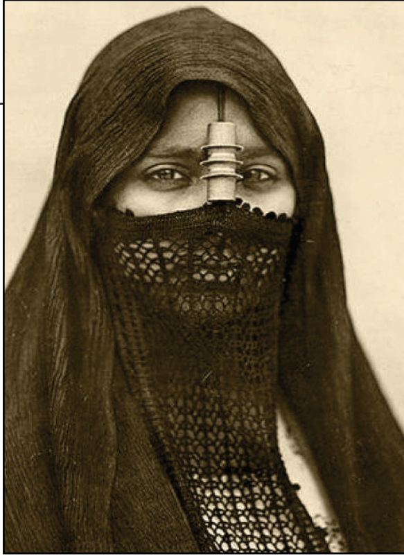
زي المرأة القاهرية في زمن الحملة الفرنسية

لتصبح أول «مقصوفة رقبة» يعلن عنها في تاريخ مصر :