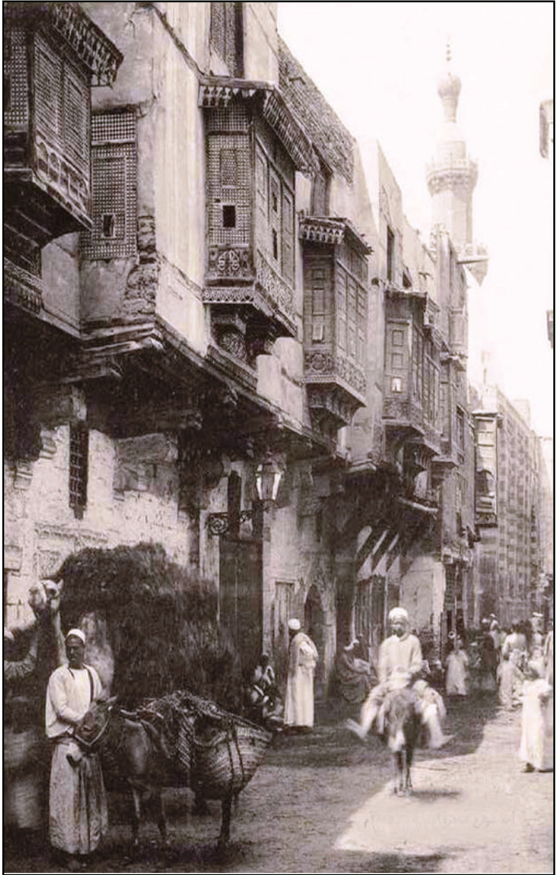
أحد شوارع المحروسة في زمن الحملة الفرنسية