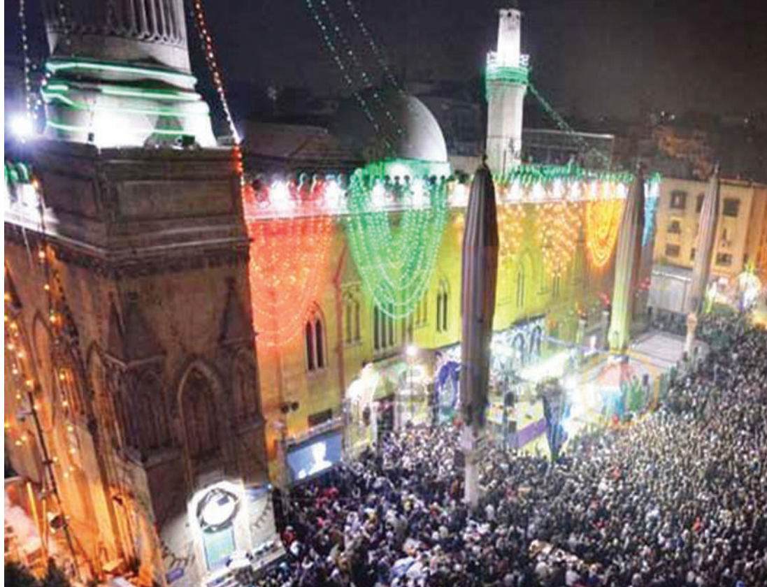
مولد الإمام الحسين