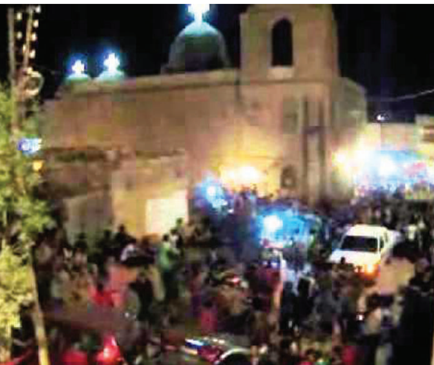
مولد السيدة العذراء