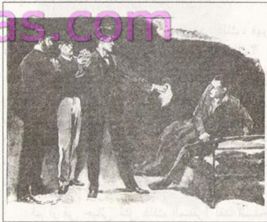
رسم سيدني باجيت ١٨٩١ Sydney Paget 1891

وهكذا فقد بدا الرجل -الذي بدأ يجلس على سريره وهو يدعك عينيه وينظر حوله في ذهول ناعس- شاحباً حزين الوجه ذا مظهر مهذب وشعر أسود بالإضافة إلى بشرة ناعمة! وفجأة أدرك افتضاح أمره فرمى بنفسه على السرير واضعاً وجهه على الوسادة.