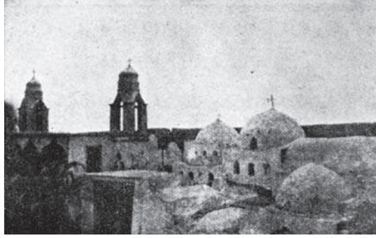
شكل ٣-٣: دير السوريان من الداخل.