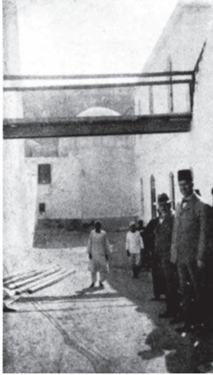
شكل ٣-٦: معبر بدير السوريان.

وأصحاب هذه الأديرة الأربعة وجدوا في عصر واحد وكلهم كانوا يعيشون في القرن الرابع الميلادي. وأول من توفي منهم ماكسيم ودوميس. ومن المحتمل أن وفاتهما كانت في الربع الأخير من هذا القرن. ودير البراموس الذي يسمى أيضاً دير الروم نسبة اليهما أقيم في الموضع الذي دفنهما فيه القديس مقار. وتوفي هذا القديس قبيل عام ٣٩٠ م. وكان لغاية هذا التاريخ لم يقم البربر بشن غارة ما.