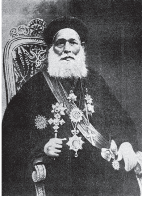
حضرة صاحب الغبطة الأنبا يوانس، بابا وبطريك الكرازة المرقسية الثالث عشر بعد المائة.