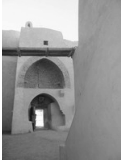
شكل ٣-٥: معبر بدير القديس مقار.