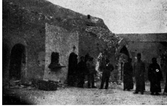
شكل ٣-٩: أبواب صوامع بدير الأنبا بشوى.

أما بقية الأديرة الأخرى فلم يبق منها إلا أطلالها. وقد روى لنا الأب المذكور في الصفحة ٣٠ من مؤلفه السابق، أن عظام القديس يوحنا القصير محفوظة في دير القديس مقار. أما دير القديس يوحنا القصير فقد ذكر أنه تخرّب تخرّباً تاماً. وقد قال بوجود شجرة الطاعة التي كانت قائمة في أنحاءه.