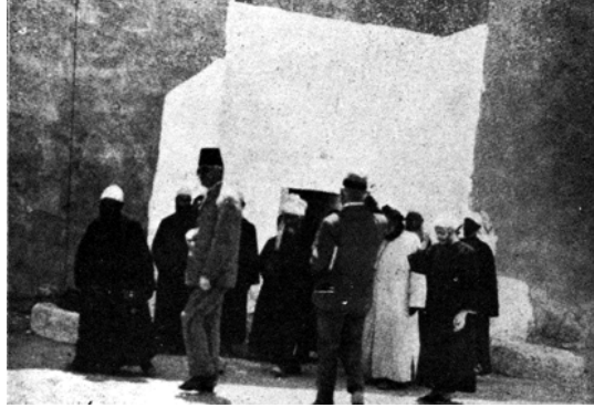
شكل ٣-١٠: باب الخروج بدير السيدة برموس.