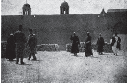
شكل ٣-١: دير السيدة براموس.

قال ابن فضل الله العمري العالم الجغرافي العربي الكبير المتوفي عام ٧٤٨هـ (١٣٧٤م) في كتابه (مسالك الأبصار في ممالك الامصار) ج ١ ص ٣٧٤ تحت عنوان (الديارات السبع) ما نصه: