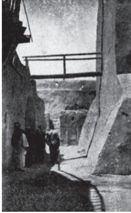
شكل ٣-٨: حديقة دير السيدة برموس.

ولكن لا شيء محال وما ذلك إلا لأننا رأينا جثتي القديس يوحنا القصير والأنبا بشوي نقلتا من مسافات شاسعة جداً. فنقلتا أولاً من كليهما من كليهما (القلزم) بجوار السويس بعد وفاة صاحبها بثلاثمائة وخمسين عاماً. ونقلت الثانية من انتينويه (انصنا) في أعالي مصر. وعلى كل حال إذا كانت هذه الشخصية هي نفس صاحب الدير المذكور فمن الأمور التي لا ريب فيها أن جثته لا بد أن تكون قد نقلت إلى وادي النظرون، وأن يكون نقلها هو السبب في بقاء ذكره في هذا الوادي.