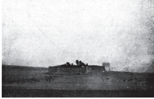
شكل ٣-٢: دير السوريان.

ولم أعلم فيها أخبارًا فأذكرها ولا أشعرا فأطرف بها وانما ذكرت لها لشهرة اسمها وبعد صيتها. ا.هـ.