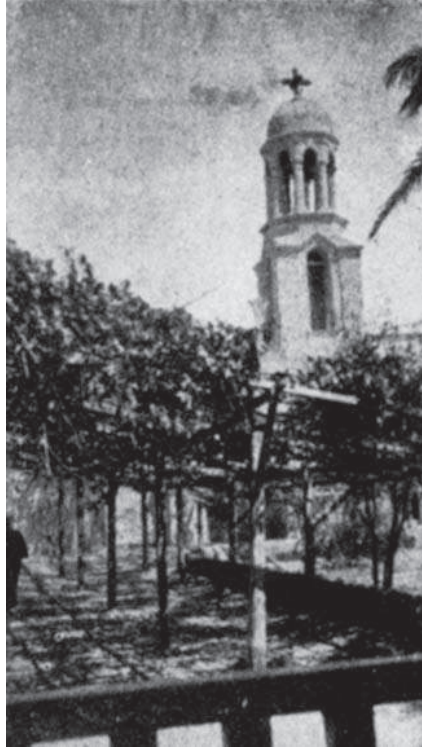
شكل ٣-٧: معبر و برج بدير برموس.

الحياة الدنيا قبيل منتصف هذا القرن. وهذا يطوحنا مراحل كثيرة بعيداً عن الحقبة التي نتكلم الآن عنها وينشأ عنه فرق يقدر بزهاء ٩٠٠ عام بين التاريخين. وهذا اعتراض وجيه يقوم في وجه من يزعم بأن هذا القديس هو صاحب الدير القائم النزاع بصدد مؤسسه. إلا أنه من المحتمل أن الصوامع التي كان نازلاً بها هو وأخوته أبقى عليها الرهبان الذين سكنوها بعده وأنهم في الوقت الذي شيّدوا فيه الدير أطلقوا عليه اسمه.