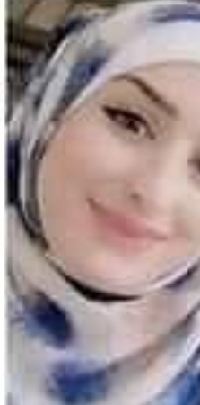
صورة فنانة تعبر عن مضمون النص "هل نخون الصحة ما جيبها؟؟".