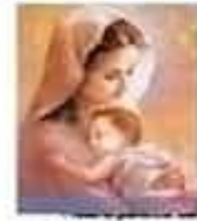
صورة فنانة تعبر عن مضمون النص "نصه نصرة".

والصحة الشخصية من فتتألم اللبس وليس فقط المشفى فيشعير بالتلصص أسما الأخرين وقلنا حينه أمام نفسه وبالأمن ما أصبح من اللعون حياة الصعبة مؤلمة حياتنا لا العظير ولا لتس خياتنا لا التول الأنا من الله ورحمة منه الكبر والذين يرتفعهم الشرق وما لله به اليد حياة مبارية بشفقة كل من يرض على صعبة يتسلى لها أوجاعه والبسة ثوب الصحة والعافية